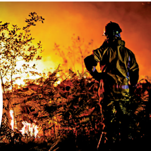
▲法國消防員18日站在熊熊燃燒的山火前。