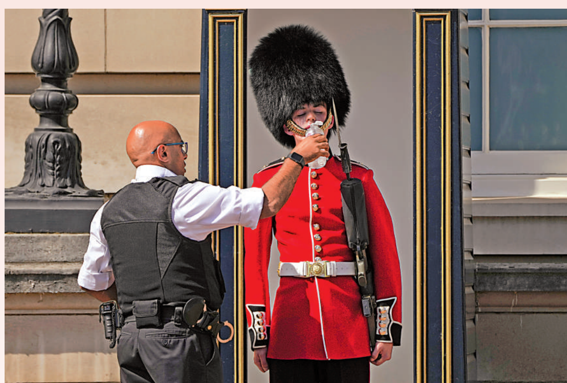
▲英國19日酷熱難當，一名警察給頭戴傳統熊皮帽的皇家衛兵餵水。

氣候變化委員會多次呼籲為新住宅建設項目制定隔熱標準，但一直被拒絕。直到今年6月，英國政府才出臺新規定，要求新住宅配備預防夏季過熱的設施。不過，成百上千萬棟老房子依然得不到保護。