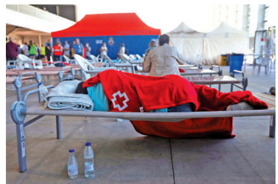
▲高溫在西班牙引發山火，逃離火場的民眾19日被安置在疏散中心。

英國政府發起的「英格蘭熱浪計劃」指出，75歲以上長者、嬰幼兒、患有嚴重疾病者和女性受高溫影響更大。荷蘭和德國的研究亦指出，高溫下女性死亡率高於男性，80歲以上的年長女性風險最高。專家猜測，這可能是因為女性排汗量較少。