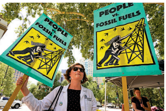
▲美國民眾6月23日抗議當局對氣候危機應對不力。

美國總統拜登的氣候法案依然難產。14日，民主黨籍參議員曼欽再次表示反對拜登的氣候政策，意味着相關法案幾乎不可能在參議院通過。曼欽代表西弗吉尼亞州，當地煤炭產業發達。拜登聲稱，即便參議院不同意，他也將通過行政手段解決氣候危機，但並未提及任何具體政策。