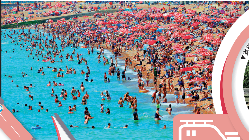
▶大批英國民眾19日到海灘消暑。