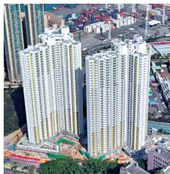
▲青富苑有180伙重售，售價由82.07萬元起。

房屋委員會新一期「特快公屋編配計劃」昨日起接受申請，合資格申請者可同時認購綠置居計劃下的柴灣蝶翠苑、青衣青富苑貨尾單位，暫有至少一百八十八個單位可供選購，包括實用面積達四百五十九平方呎的大單位，而部分細單位的按揭月供只需約三千五百元，隨時平過劊房租。 有輪候公屋的劊房戶認為，「有得揀供樓」好吸引，惟首期負擔是問題，擔心疫下隨時失業，不敢輕言置業，但希望透過「特快公屋」上樓，早日有個安樂窩。房委會委員兼公屋聯會總幹事招國偉預期，今期「特快公屋」計劃申請有望創近年新高。 大公報記者 曾敏捷