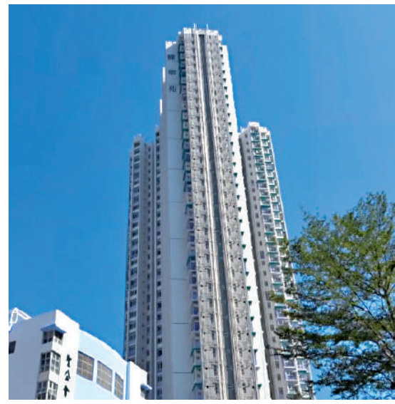
▲蝶翠苑尚餘8伙重售，售價由105.84萬元起。