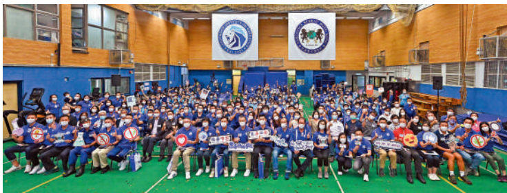
▲警務處今年6月舉行「禁毒領袖學院」啟動禮，展開為期一年的青少年禁毒領袖培訓計劃。