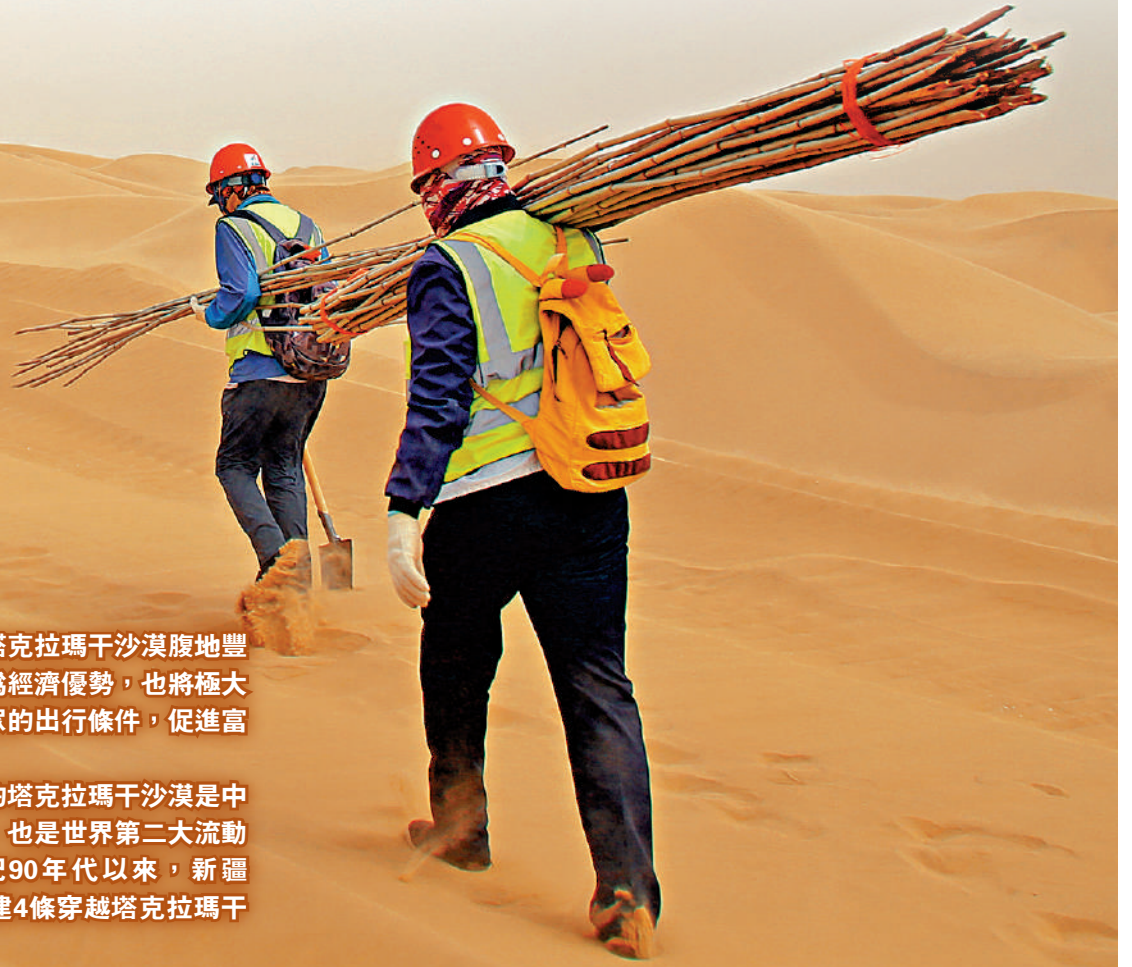
▼建設團隊行走於高溫乾旱的沙漠腹地。