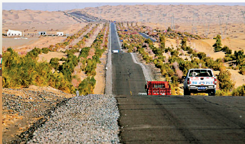
▲已建成的沙漠公路極大便利當地居民的出行。

新疆生產建設兵團第一師阿拉爾市十四團至且末縣的塔中沙漠公路全長136公里，為師市以及南疆縣市提供了新的出疆通道。由此，阿拉爾市到且末縣縮短了500公里，到若羌縣縮短了近700公里，到青海格爾木縮短了將近700公里。