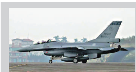
▲台當局向美採購66架F-16V戰機後，想再購買戰機所需的AGM-158遠程導彈，但未獲美方同意。網絡圖片

《中國時報》報道稱，以前美台軍售極少出現後勤相關項目。但拜登政府最近4次公布的對台軍售賣的不是可提供戰力的武器裝備，全是零部件與技術援助項目，且金額都不大。拜登政府只有第一次對台軍售是出售M109A6自行火炮，但這是特朗普政府通過的，而美方後來又對該案「以生產線受到排擠」為由叫停。