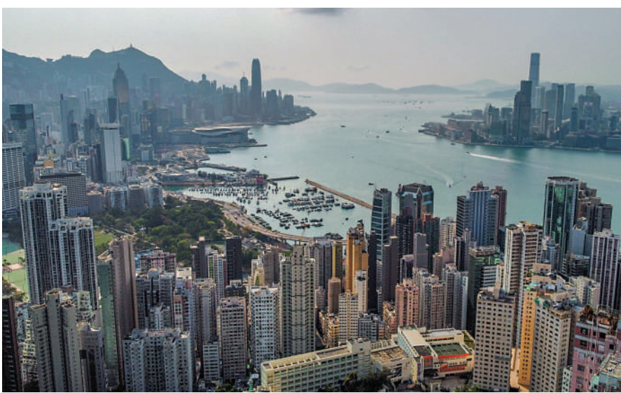
▲銀行公會表示，新支付安排可加強對住宅按揭客戶的保障。