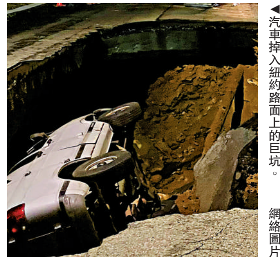
▲汽車掉入紐約路面上的巨坑。

另外，美國內華達州和亞利桑那州邊界的胡佛水壩的一台變壓器19日發生爆炸，冒出火光及黑煙，大約半小時後被撲滅。胡佛水壩高221米，為美國最高的水泥大壩之一，也是熱門旅遊景點。其17台發電機組可為170萬戶家庭、約800萬人供電。