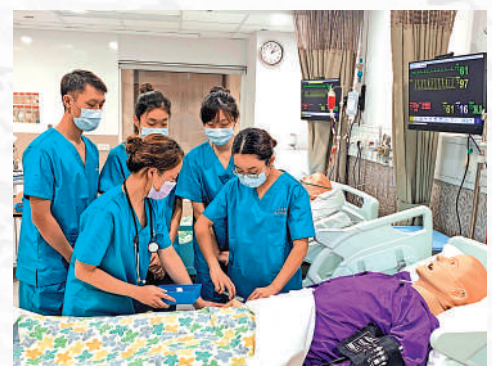
▲ 香港中文大學的護理學士學位去年DSE收生分數中位數為29分。

中文3分、英文3分、數學2分及通識2分，另外任何兩科選修科要達3分（若選修科為生物/化學/物理/組合科學/綜合科學可優先），而去年有關科目的DSE收生分數中位數為29分。