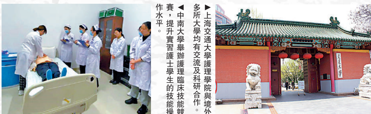
◀ 中南大學舉辦護理臨床技能競賽，提升實習護士學生的技能操作水平。