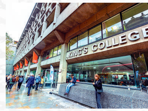
▲ 倫敦國王學院護理系在2022年QS世界大學學科排名位列第二。

而香港學生可以中學文憑試成績申請報讀該校的護理系，當中要求三門選修科目至少達到5、4、4級，再加上四門核心科目中的每科達到4級。