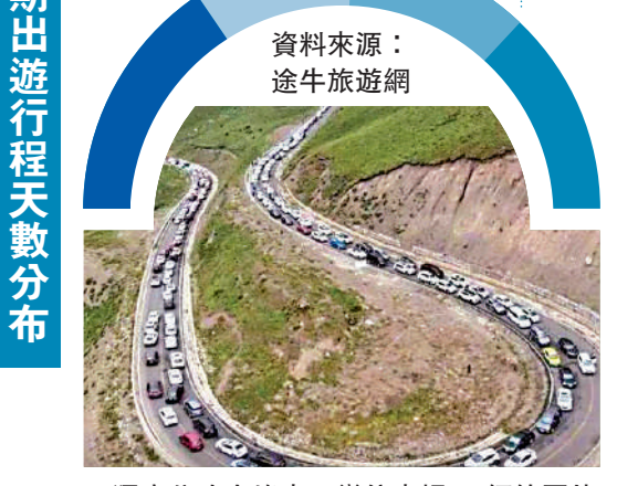
▲獨庫公路大堵車，變停車場。網絡圖片