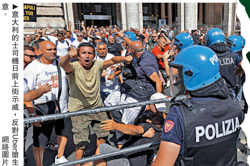
▲意大利的示威日前上街示威，反對Ugo法官

今年以來，法國總統馬克龍艱難贏得連任但卻成為「跛腳鴨」，德國總理朔爾茨執政未穩且陷入醜聞，英國首相約翰遜被迫下台，意大利原本在德拉吉的領導下重回歐洲中心。西班牙首相桑切斯19日在Politico上撰寫了一篇題為《歐洲需要德拉吉這樣的領導人》的評論文章，稱歐洲面對能源危機、高通脹率、俄烏戰爭等多重危機之際，德拉吉起到了關鍵作用。法國歐洲事務部長布恩21日表示，德拉吉辭職將開啟「不確定時期」，並標誌着「歐洲支柱」的喪失。