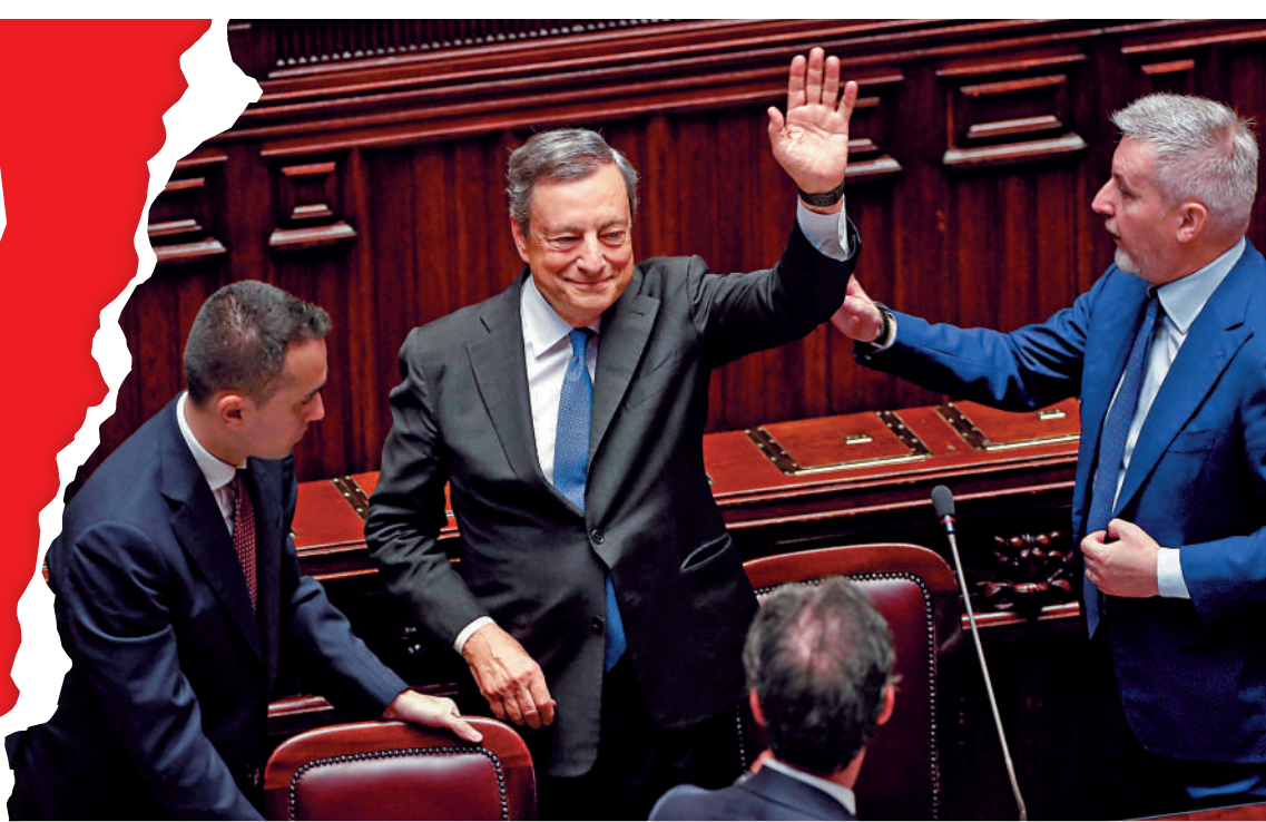
▲意大利總理德拉吉（中）21日在議會完成發言後揮手致意。