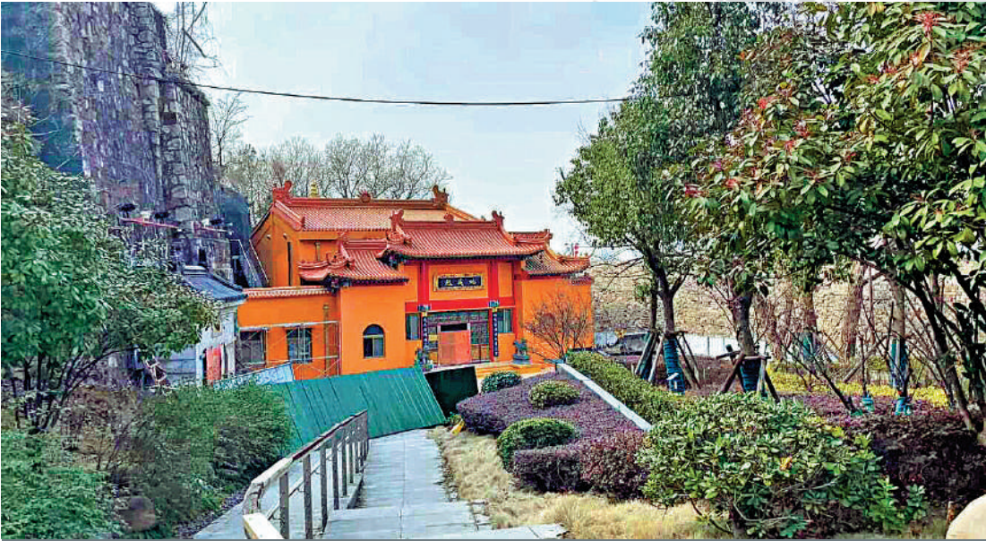
▲南京玄奘寺日前傳出供奉南京大屠殺戰犯牌位，當局已責令該寺停止日常活動，並進行整頓。