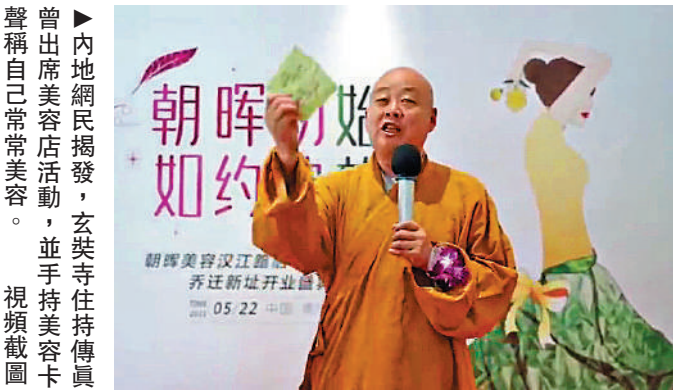
曾出席美容店活動，並手持美容卡聲稱自己常常美容。 ►內地網民揭發，玄奘寺住持傳真 視頻截圖

「揚州的寺廟今天已經全部緊急排查供奉牌位」，針對南京玄奘寺居然供奉侵華日軍戰犯牌位，揚州大明寺住持能修極為憤怒，「這麼做太不應該，嚴重挑戰了我們中國人的民族感情！」能修介紹道，通常小寺廟會收費供奉牌位，各個寺廟的價格都不一樣。「但是住持應該看一看供奉的是哪些牌位，這四個侵華日軍戰犯的牌位竟然已被供奉了一年多，這麼長時間都沒被發現！」能修披露，22日全江蘇的寺廟在緊急自查供奉牌位。