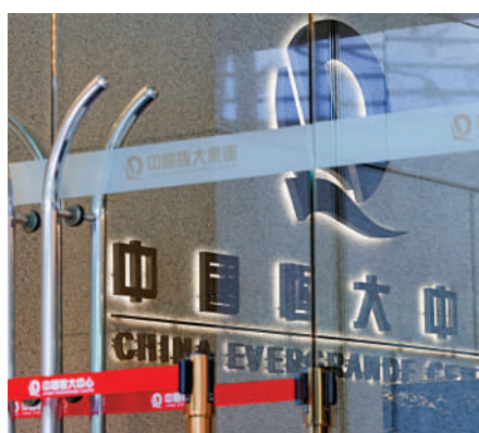
▲恒大及恒大物業昨晚公布，要求6名高層辭任職務。

此外，正面對財困的融創中國(01918)再傳來壞消息，內地傳媒引用「天眼查」數據顯示，集團旗下有7家子公司資產，被法院裁定，查封、凍結名下銀行賬戶存款約4.05億元人民幣(約4.7億元)。資料顯示，申請人為光大興信託有限責任公司。