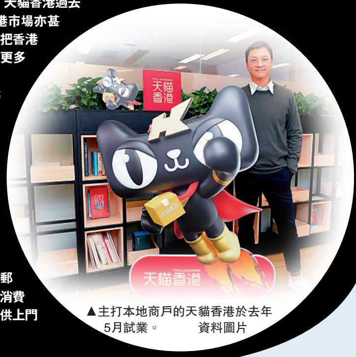
▲主打本地商戶的天貓香港於去年5月試業。資料圖片

儘管天貓香港即將關閉，因為天貓香港與淘寶香港站共用同一團隊，所以關站並不影響原有的員工。