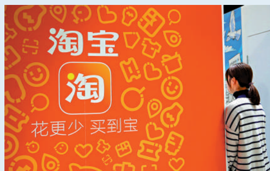
▲天貓香港關閉後，資源將集中發展淘寶在香港的服務。