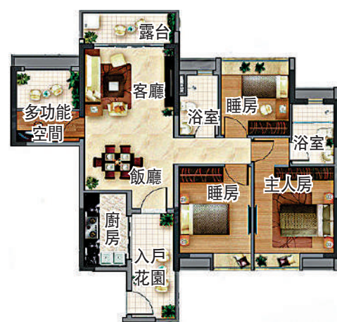
▲大夫山·尚東110平米戶型圖。