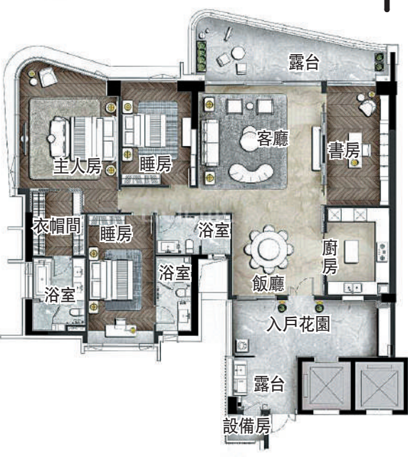
▲南天名苑270平米戶型圖。