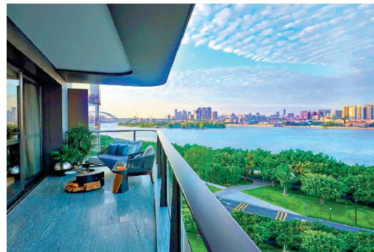
▲南天名苑示範單位露台視野寬闊。