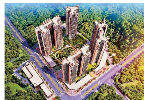
▲大夫山·尚東效果圖。

風效果。由於客廳與露台相連直至露台，所以整個戶型視覺效果看起來更大。110平米的4房2廳戶型方正，加上3.6米寬的觀景大露台，提高了整體的居住舒適度。該戶型為3+1房設計，多出來一個可以自行改造的小露台，可以改造為活動空間或者儲物間。另外，入戶花園面積也不小，可以在此處種一些花草，提高生活的樂趣。