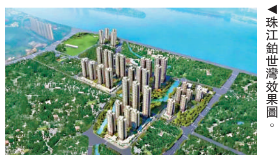
▲珠江鉞世灣效果圖。

18號線萬頃沙至洗村段，預計9月底通車。另外，南大幹線預計2022年全線通車，未來可實現便捷串聯全城。教育的配套也很強，2020年8月，珠江鉞世灣引進華附番禺，為首度落子番禺的公辦小學，學校去年9月已迎來首批學生入讀。該校較早前也被納入了「十四五」規劃教育重點工程。此外，周邊更有華附番禺附屬小學、番禺執信中小學等知名學校，孩子的教育得到保障。