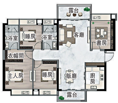
▲珠江鉞世灣125平米戶型圖。