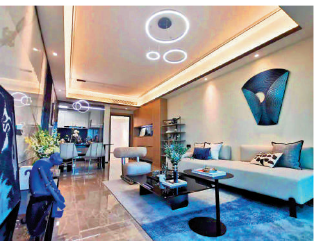
▲珠江鉞世灣示範單位客廳。