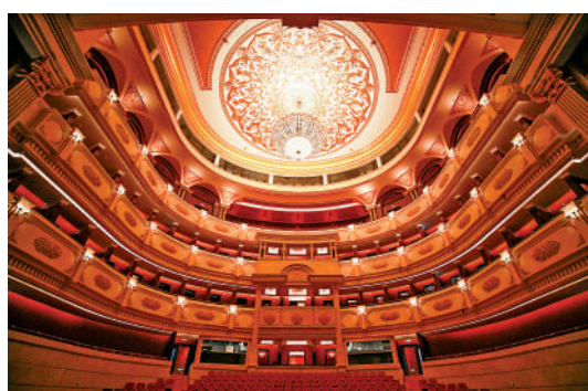
▲莫華倫時隔25年，再次登上中央歌劇院的全新舞台獻演。