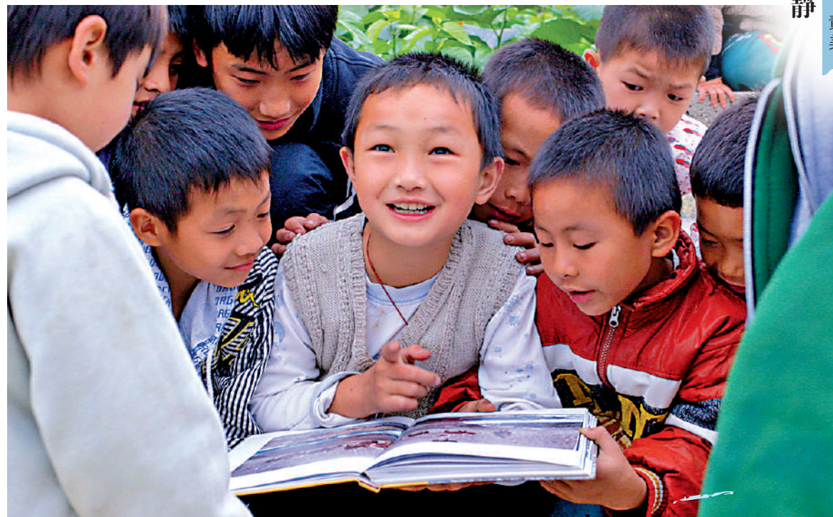
▲《絲路傳奇及長安——天山行》劇照。

象，他毫不掩飾自己對中國傳統詩歌的熱愛，他認為詩歌具有繞樑三日、耳濡目染的效果。在影片的開頭，林培鈞向觀眾展示了一隻蠶是如何結繭的過程，充滿中國古典味道的畫面，配合西方音樂，具有別樣的詩意。另外，影片中還展示了「蠶」字各種不同的寫法，林培鈞認為，這體現了中國人以文字為思想的特色。在林培鈞看來，文化表達「最難的是知已知彼、互相交融」，他以自己的方式，以他作為一個香港人的視野，講中國故事。