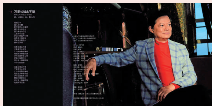
▲《一起走過的日子》收錄《萬里長城永不倒》。