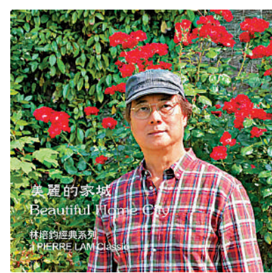
▲林培鈞創作的《美麗的家城》。

此外，他創作的《美麗的家城》旋律舒緩，令人印象十分深刻。林培鈞表示，這首歌曲創作於2年前，「是在當時香港社會不太穩定的時候創作的，表達對於香港穩定發展的期望。」