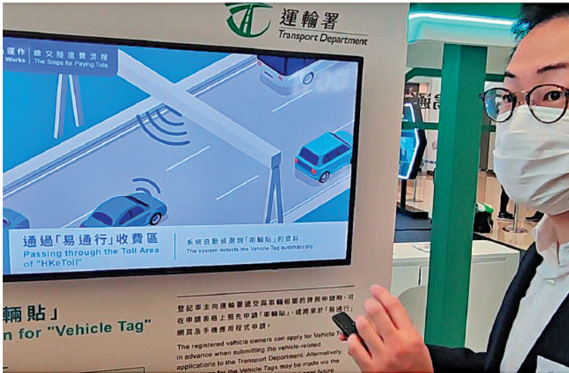
▲「易通行」不停車繳費服務讓駕駛者可透過繳費貼遙距繳付政府收費隧道和青沙管制區的隧道費。