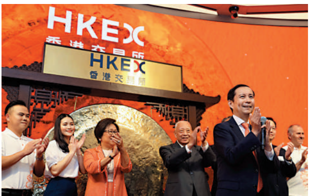
▲2019年11月26日，阿里巴巴在港交所第二上市。當日，董事會主席兼首席執行官張勇暢談集團的願景。