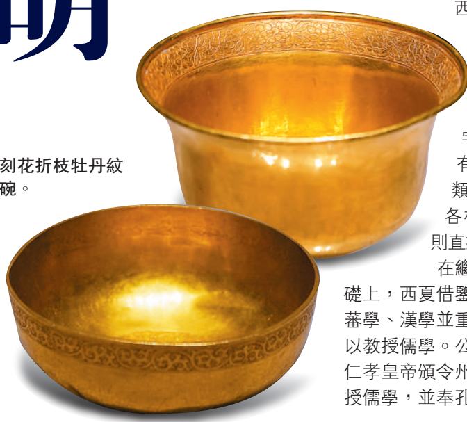
▼刻花折枝牡丹紋金碗。

令州郡立廟奉祀。三年後，仿照中原科舉制度開科取士，儒家思想成為西夏統治的主導思想。西涼府文教興盛，蔚然成風，西夏時期就建有文廟，也足見對儒學的尊崇。 除了教授儒學，西夏風信佛教。在統治者的大力扶持下，境內寺院廣布，塔廟林立。從元昊到乾順五十多年時間，西夏共譯成三千五百七十九卷西夏文大藏經。作為中國最早的少數民族文字大藏經，它帶頭把大藏經由漢文推廣到了少數民族文字。據武威出土的佛經題款記載，天梯山石窟寺、涼州護國寺都是西夏重要的佛經譯場。