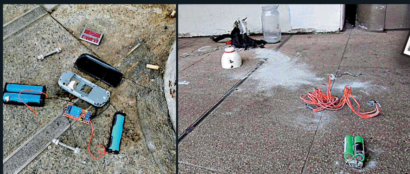
▲極端恐怖組織「九十二籤」承認2020年1月深圳灣口岸（左）及同年2月羅湖港鐵站爆炸案（右）均是該組織所為。