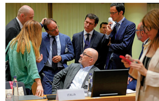
▲歐盟成員國26日通過節約用氣提案，圖為意大利代表團。

俄羅斯國家航天集團公司總裁鮑里索夫26日表示，俄方已決定於2024年退出國際太空站計劃，並開始建設自己的太空站。