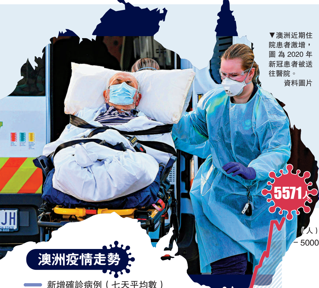
▲澳洲近期住院患者激增，圖為2020年新冠患者被送往醫院。資料圖片