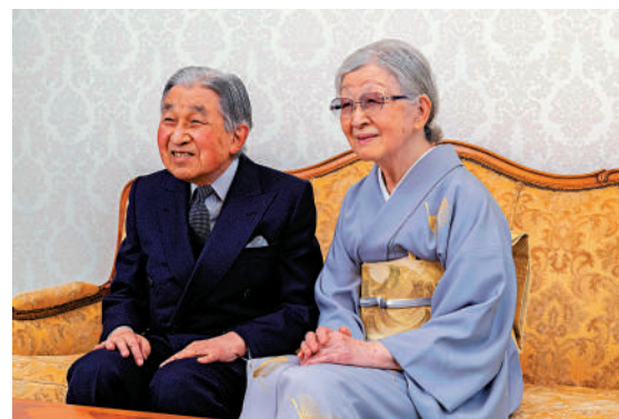
▲日本上皇明仁（左）和上皇后美智子健康問題引關注。資料圖片

繼位，2019年4月30日退位，為日本皇室近200年來首位在世時退位的天皇。1959年，明仁與正田美智子結婚，開創日本皇位繼承人與平民結婚的先例，婚後育有二子一女，包括如今的天皇德仁。2015年，明仁在日本政府主持的「全國戰歿者追悼儀式」上表示對二戰「深刻反省」。