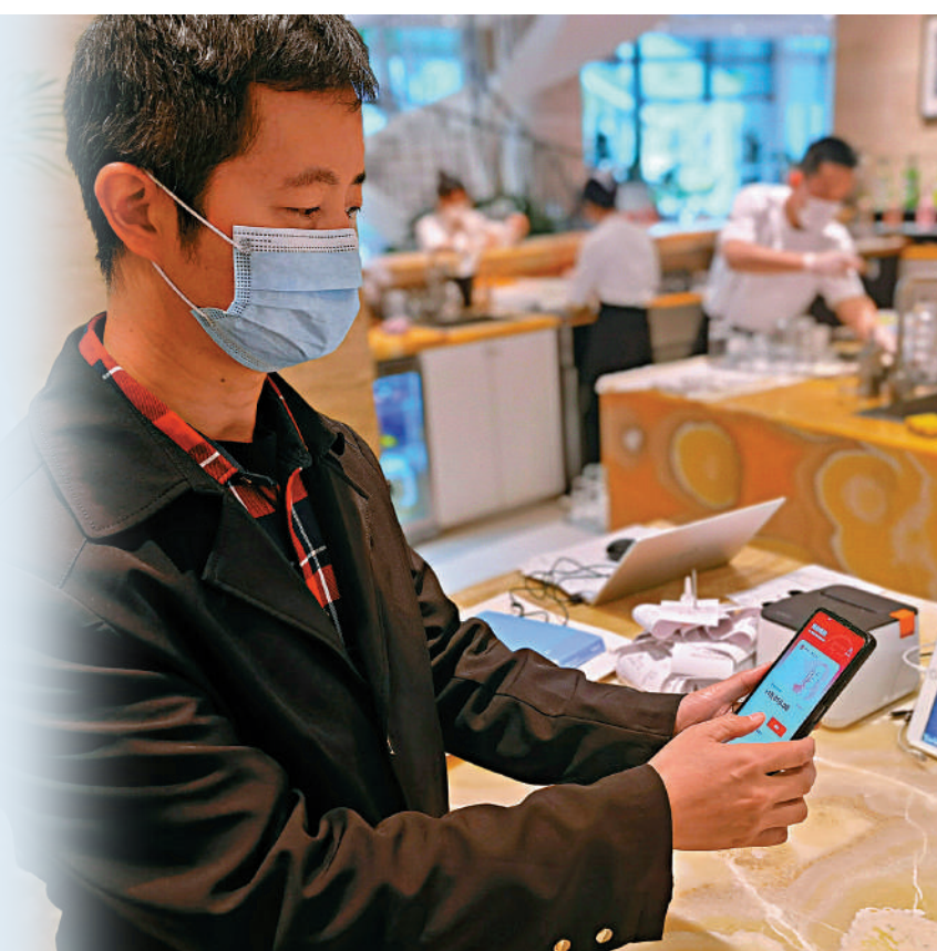
▲4月2日，廣州南沙率先推動數字人民幣各方面應用場景落地，圖為南沙人才局以數字人民幣形式發放人才獎勵補貼。