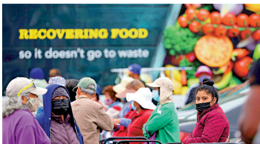
▲美國大幅加息逼通脹，令經濟形勢急轉直下。

尼，對美國經濟看法更加悲觀，預期正面臨深度衰退，認為當前美國經濟危機，比上世紀七十年代的滯脹困局與2008年金融海嘯更加嚴重，原因是美國同時面對滯脹、高債務的雙重夾擊，應對問題複雜得多，增加經濟硬着陸風險。