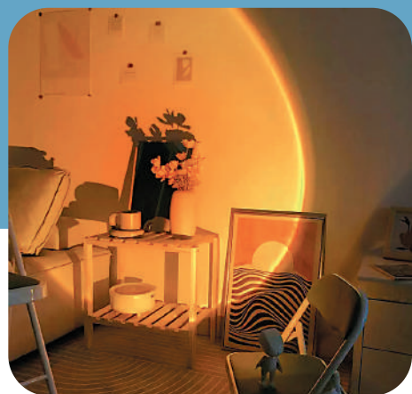
▶「日落夕陽燈」採用橘黃色的LED光源，給人以溫暖舒適的感覺。

在家居環境中，我們可以在不同的區域使用不同風格的氛圍燈，烘托出不一樣的環境氛圍。最近比較熱門的氛圍燈中有一款叫做「日落燈」或「夕陽燈」，受到很多人的喜愛。它採用橘黃色的LED光源，配合玻璃透鏡，讓照射出去的光線打在牆上就像日落時分，給人以溫暖舒適的感覺。一塊白牆，經過它的照射，一下子就達到了類似裝飾畫的效果。另外，由於它的燈光呈現出漸變的色彩，用它拍人像，還可以拍出日落餘暉般氛圍的照片。非常適合放置在平時家裏不太能被陽光照射到的位置，會給你一種陽光直接射進來的「美好錯覺」。