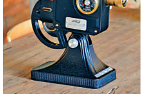
▲「堅果1895」投影機將現代技術與復古的放映機巧妙結合。

隨着家用投影儀的普及，越來越多的人在客廳或臥室安裝一台投影儀。但普遍的，大多數投影儀的外形還是比較「科技範」，如果家裝風格是復古或者日系田園風格的，那麼一款外觀充滿現代科技感的投影儀很可能會打破家居氛圍的和諧。來自堅果（JmGo）的投影儀則獨樹一幟地將投影儀與早年的古董電影放映機結合到了一起。它的型號被定為「堅果1895」，為的是紀念1895年盧米埃兄弟在巴黎進行了首次收費的公開電影放映。