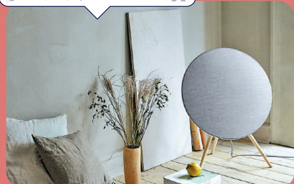
▲B&O Beoplay A9無線喇叭，若一件時尚的傢俱。

B&O Beoplay A9無線喇叭，想必大家在網絡上曾見到過：它外觀看起來並不像一款音響，而像是一件傢俱。圓盤形的音響機身正面，採用了織物面罩，而在這面罩下面，是採用了黃金分割數列排列的大小不同的透音孔，從而確保其穩定而美妙的聲學特性。這款音響也曾獲得德國iF設計獎。