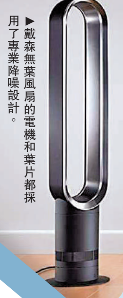
▲戴森無葉風扇的電機和葉片都採用了專業降噪設計。

傳統的落地風扇都是採用電機直接帶動電扇葉片旋轉從而吹出涼風，因此外形都是上面一個圓形扇葉，下面是用於固定底座。它外形並不美觀且比較佔用空間，讓我們很難將風扇與「藝術」二字聯繫到一起。而戴森則通過巧妙而優雅的工業設計打破了這個傳統，造出了全球著名的無葉風扇產品，受全世界消費者的好評。