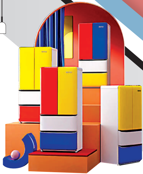
▲MiniJ（小吉）品牌推出的蒙德里安配色的雪櫃。

雪櫃是使用頻率很高的家電產品，但它的外觀和色彩往往都是比較低調和乏味的。過去，在我們的意識裏，挑選雪櫃時更多的是看中它的功能和內部空間這兩點。雪櫃作為家中大型物件，佔較大的體積，我們完全可以將它設計得更加色彩豐富，從而讓它在家居環境中也能夠活力四射。MiniJ（小吉）品牌推出的蒙德里安配色的對門式雪櫃，就抓住了現在消費者追求個性的需求，打破常規，大膽地在雪櫃各個門的表面採用了紅、黃、藍、白等顏色的塗層，讓人一眼就想起了荷蘭藝術大師蒙德里安（Piet Mondrian）的系列畫作，頗具現代主義藝術氣息。