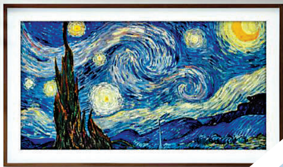
▲三星「The Serif」電視的外觀有如油畫框一樣的造型。