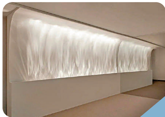
▲「水波紋洗牆燈」能在牆上投射類似水面波光粼粼的效果。

還有一款網紅氛圍燈最近也經常出現在大家的視野，被稱為「水波紋洗牆燈」。它能夠在牆上投射出類似水面波光粼粼的光影效果。原理簡單，基礎光源是一條LED燈帶，還可以切換燈光顏色。在燈珠上方增加了一根可以旋轉的表面帶有不規則紋理的透明管。當燈光透過這樣帶有紋理的管身照射到牆面的時候，光線經過這些紋理不規則的折射從而呈現出一種水波紋一樣的感覺，這個氛圍燈還有不同的版本，有的透明管可以旋轉，這樣照射出來的光就更像是泛着漣漪的水面了，極具藝術氣息。