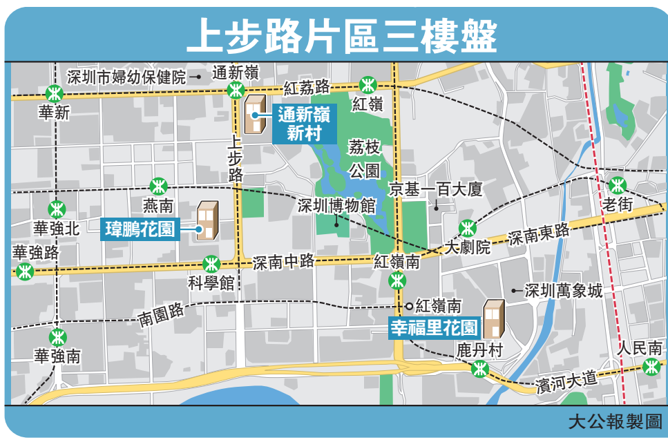
上步路片區三樓盤

深圳上步路的科學館、華強北的商業街、燕南路的美食、深南東路的繁華商業……走在地鐵6號線通新嶺站及科學館站的街道上，沒有太多觸摸城市天際線的高樓大廈，老城區的悠然自得隨處可見。作為老牌中心區的上步路，由於成熟片區的優質學位及生活便利，該片區成為很多深圳人購置二手房的首選，平均單價穩定在每平米10萬元（人民幣，下同）上下。