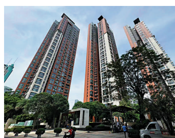
▲幸福里花園是華潤中心的住宅部分。