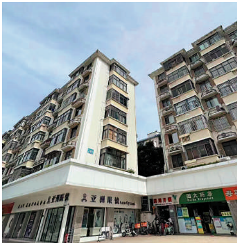
▲通新嶺新村周圍市政配套優質。

因此周圍的市政配套都是最優質，除了優質的學校，還有優質的體育鍛煉設施、優質的社區圖書館、優質的休閒散步場所。「且因為片區居住的多數是高素質人群，小區鄰里關係好，居住氛圍純粹，適合有孩子的家庭。」