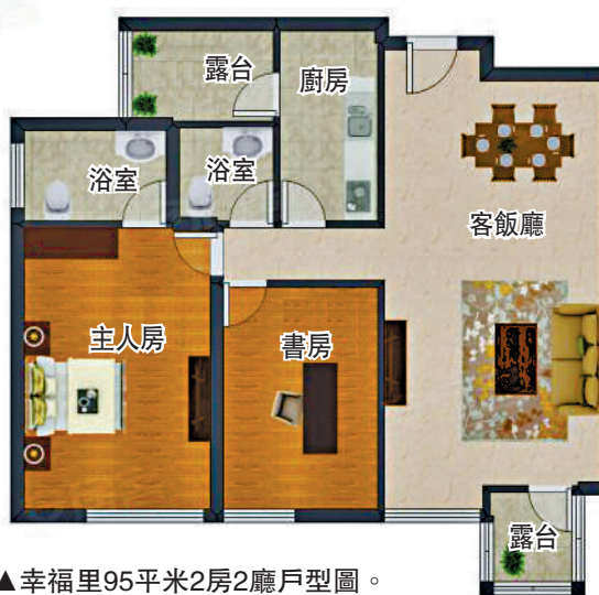
▲幸福里95平米2房2廳戶型圖。

的空間品質感，特點是10平米空中花園，有大廳和大主人房。豪華型：180平米以上，注重打造空間品質的差異感，特點是15平米空中內庭園，有中、西廚設計，帶工人房等。