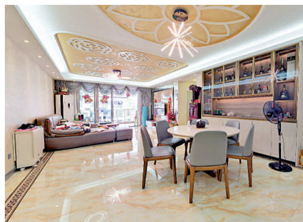
▲瑋鵬花園客飯廳。