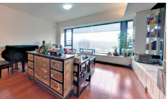
▲幸福里花園外觀及內部設施保養俱佳。

幸福里的戶型主要有3類。經濟型：90至95平米，注重在既定面積下的功能需求，特點是觀景小露台，雙浴室，主人房帶浴室，追求實用率。舒適型：140至145平米，注重在既定功能下