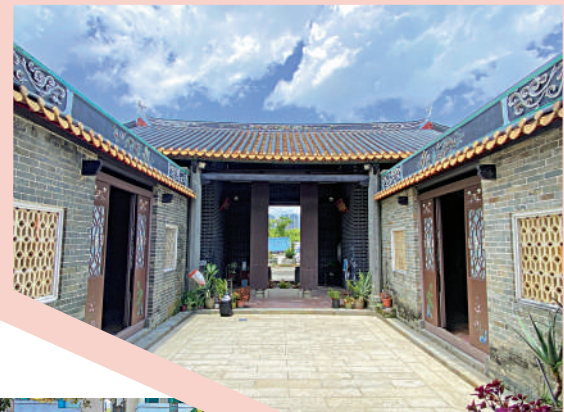
廣瑜鄧公祠屬兩進一院三開間布局。

過往，廣瑜鄧公祠曾先後改建為店舖和工廠。根據香港大學圖書館一張1962年蔡炳賢所攝的照片，當時廣瑜鄧公祠成為財記茶室，曾是叔伯父老聚腳聊天地方。到1970年代末至1980年代初用作金屬品製造廠，後遭荒廢，至1995年才全面修復。1996年竣工後，鄧氏於元宵前來宗祠進行點燈儀式。