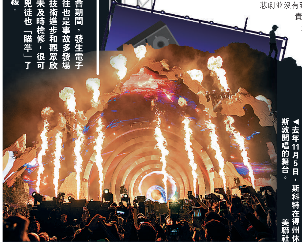
去年11月5日，斯科特在得州休斯敦開唱的舞台。

【大公報訊】香港男子團體MIRROR本月28日晚在紅館舉行演唱會期間，發生電子大螢幕擊中舞蹈人員意外，讓外界震驚。放眼全球，大型演出活動往往也是事故多發場合。現場觀眾成千上萬，稍有不慎，極易發生踩踏等事故。近年隨着技術進步和觀眾欣賞水平提高，主辦單位多挖空心思設計「機關」，但若安裝不到位或不及時檢修，很可能發生各種故障，威脅表演人員和觀眾安全。此外，恐怖分子和獨狼兇徒也「瞄準」了大型活動現場施襲，製造恐慌。加強演出安全的監管和保障，刻不容緩。