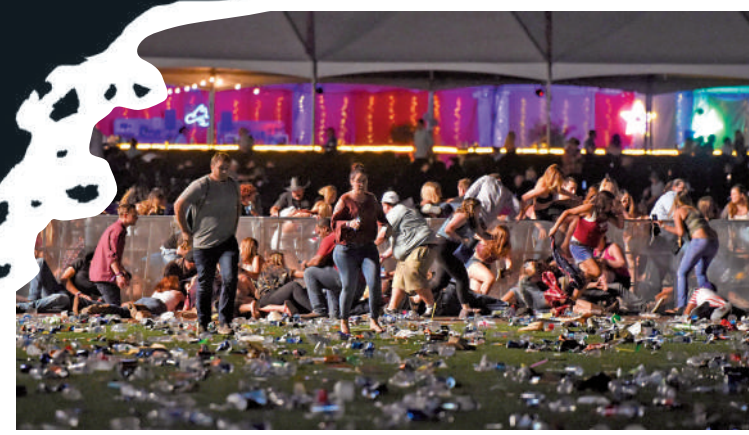
▲拉斯維加斯音樂節發生槍擊案，觀眾四散逃命。