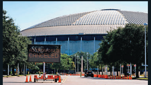
▲慘劇發生後，該場館後續的音樂節活動取消。

站在台上的斯科特非但沒有大聲呼籲觀眾冷靜，甚至在看到救護車後依然沒有叫停演出，反倒要歌迷對着天空比中指，要大家繼續歡呼。有目擊者表示，演唱會在意外發生後40分鐘才結束。