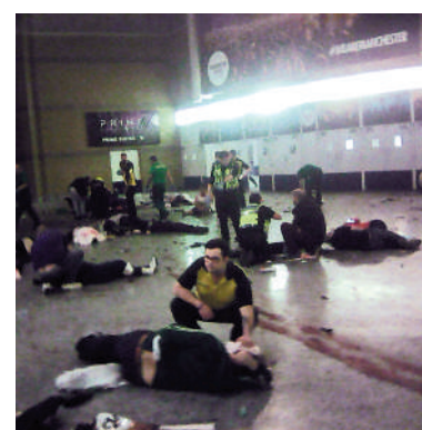
▲曼徹斯特體育場發生爆炸，救援人員在場內照顧傷者。

據悉，獨狼槍手從附近酒店32層持槍對着底下音樂節現場22000名觀眾，發射了約1000發子彈。