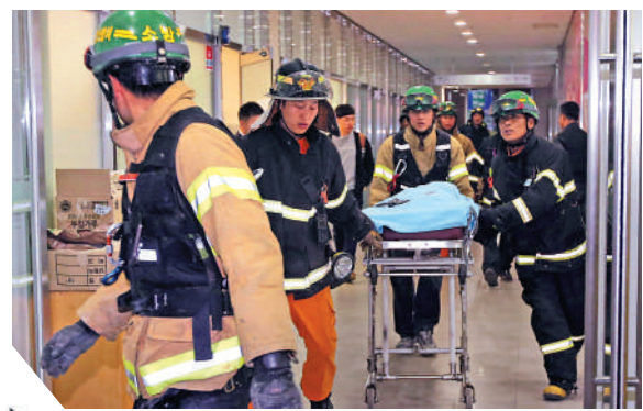
救援人員將傷者送院治療。

2015年1月，韓國女子天團少女時代成員太妍在表演完準備離開舞台時，因為沒注意到舞台上的升降機關，加上舞台燈光全暗，整個人不小心踩空，當場墜落舞台。事後她被緊急送院治療，醫生診斷她腰部拉傷。不少粉絲認為主辦單位沒有嚴格管控舞台機關，導致藝人受傷，要求主辦單位出面道歉。