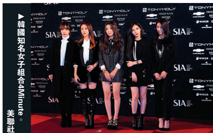
韓國知名女子組合4Minute。