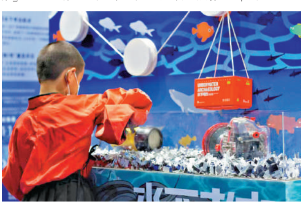
▲小朋友挖掘水下考古盲盒。

元的體驗。首場活動就以「吃喝玩樂、雲遊粵博」為主題，推出文創雪糕、「荷塘粵夏」特飲、水下考古盲盒等文創新品。同時，在天貓旗艦店推出「雲