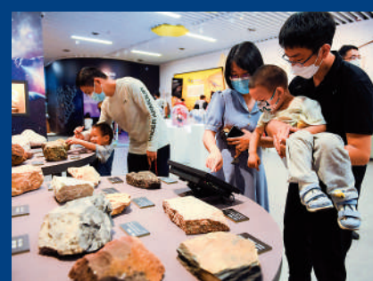
▲家長帶着孩子參觀岩石標本。