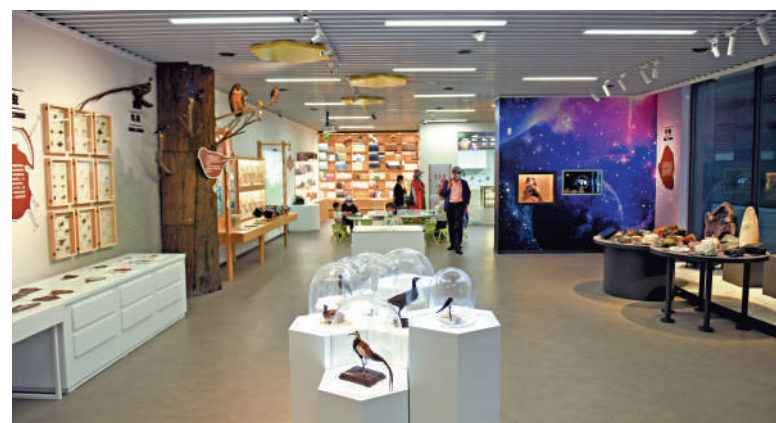
市民在「浙江自然博物院·24小時博物館」內參觀，館內設置多個展示區及互動體驗區，並在周末開展研學講座。

館」與各大院校聯合創建多種多樣的研學課程，包括能「沉浸式挖礦」的「化石小獵人」、自己動手製作簡易火山的「火山大爆發科考隊」、學習如何清理、挖掘、保護恐龍化石與各類寶石的「探索恐龍世界」和「大地瑰寶」，這些都能讓孩子們在實驗、動手中學習知識。