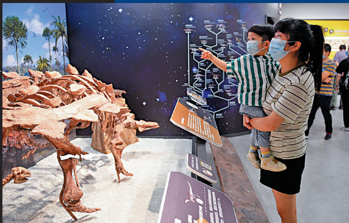
▲家長抱着孩子在「24小時博物館」內參觀恐龍標本。