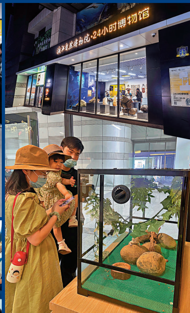
▲多種多樣的研學課程讓孩子們動手又動腦。