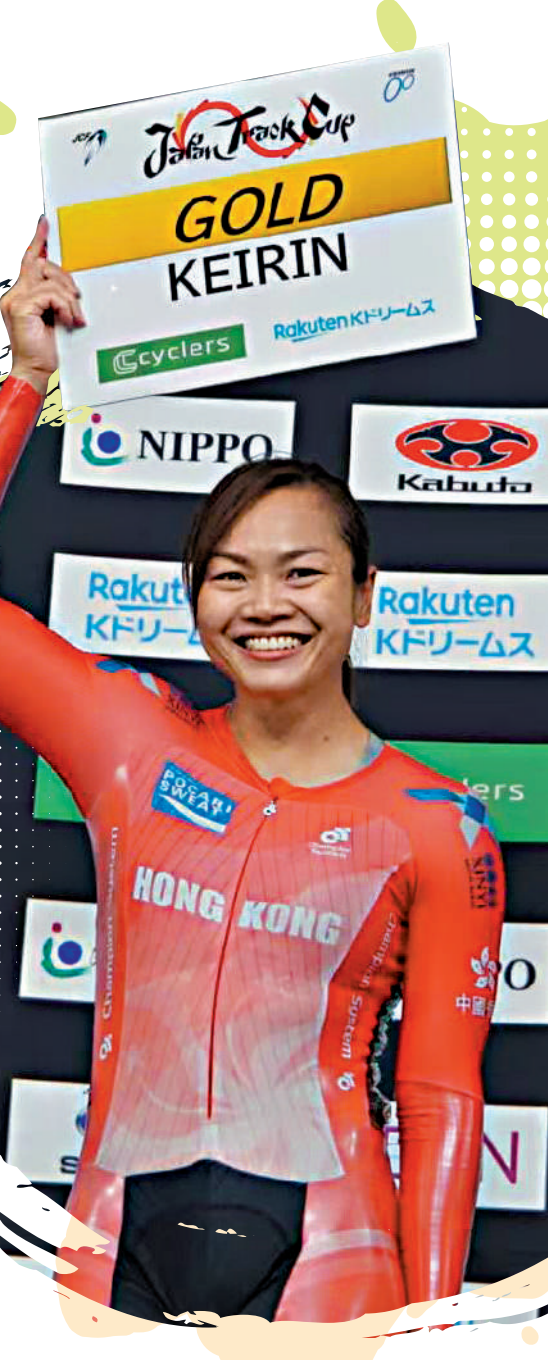
▶李慧詩勇奪凱琳賽冠軍。