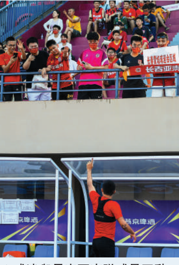
▲球迷與長春亞泰隊球員互動。

【大公報訊】據中新網報道：中超聯賽第二段賽程出爐，首戰將於8月5日打響。目前已有11支球隊回歸主場比賽，2隊選擇異地主場，5隊暫赴中立主場海口賽區比賽。 據了解，中足聯籌備組30日召集各中超俱樂部、中超賽區地協負責人，於線上召開了2022賽季中超聯賽主客場賽前工作會議，會議明確了中超主客場的賽區賽場、賽程賽歷、競賽組織、防疫、商務、媒體等相關工作安排。 11支回歸主場作戰的俱樂部分別是山東泰山（濟南市奧體中心體育場）、廣州隊（廣州市花都體育場）、長春亞泰（長春市體育中心體育場）、廣州城（廣州市越秀山體育場）、河南嵩山龍門（鄭州市航海體育場）、武漢長江（武漢市五環體育中心體育場）、武漢三鎮（武漢市體育中心體育場）、梅州客家（梅州市五華奧體中心體育場）、浙江隊（湖州市奧體中心體育場）、成都蓉城（成都市鳳凰山專業足球場）、大連人（大連市普灣體育場）。 異地比賽的球隊分別是上海海港（大連市體育中心體育場）和上海申花（大連市金州體育場）。 在海口賽區中立主場進行比賽的俱樂部分別是