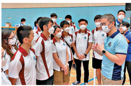
▲警務處處長蕭澤頤與一眾少年警訊會員參與「青興計劃」啟動禮暨同樂日。