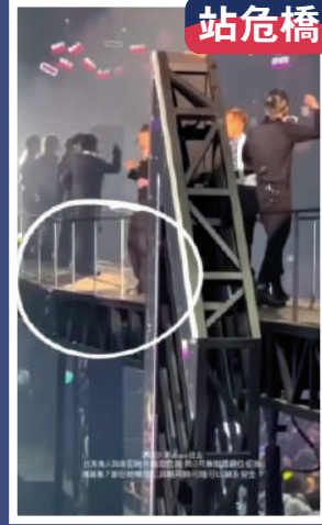
▶ MIRROR在升高的長橋舞台表演時，長橋搖搖欲墜。

另外，有份參與演唱會的23名舞蹈員昨日發表聯合聲明，指現階段不便作任何評論，亦不會接受任何傳媒採訪。對於近日有匿名留言在網絡平台流傳，聲明澄清都不是出自他們任何一人，亦沒有發起眾籌。