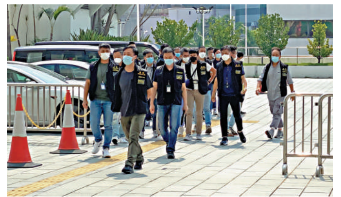
◀警方西九龍總區刑事部探員，昨日到紅館調查及搜證。