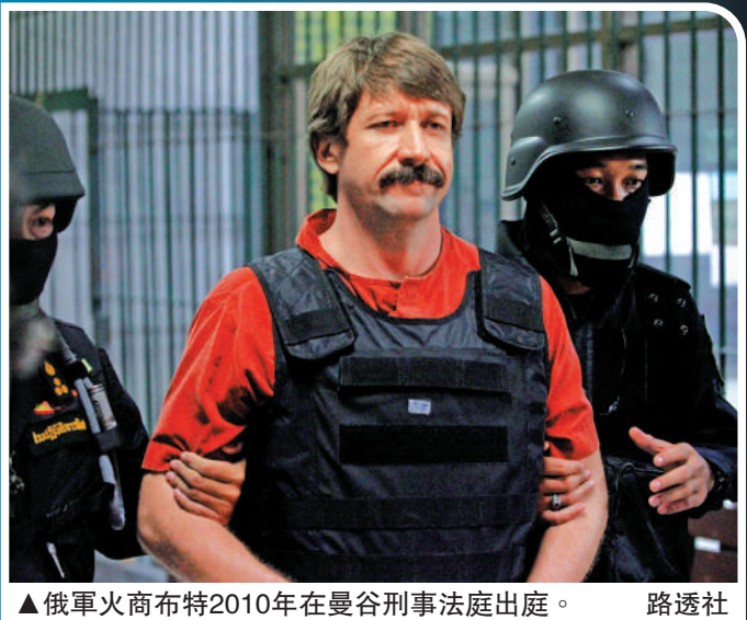
▲俄軍火商布特2010年在曼谷刑事法庭出庭。