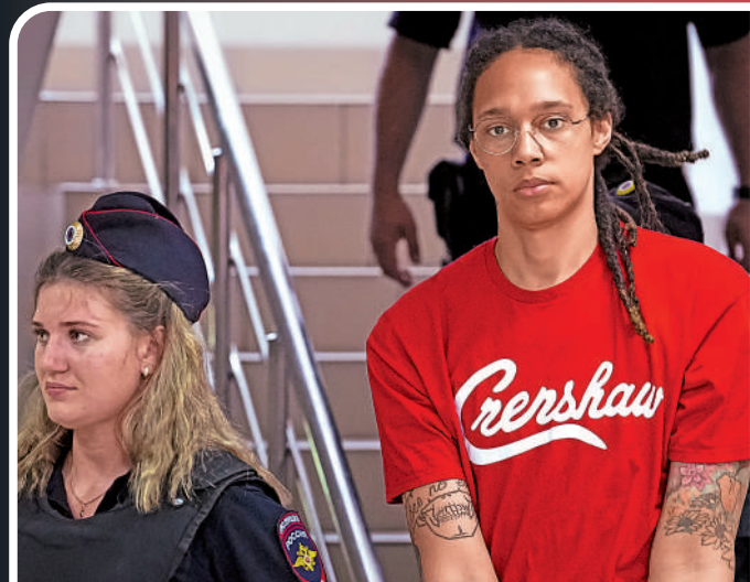
▲美籃球女星格林納7月7日在俄法庭受審。