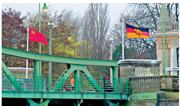
▲冷戰時期連接東西德的「間諜橋」，圖為電影《換諜者》場景。

10名俄羅斯間諜，其中包括俄著名美女間諜查普曼。查普曼在紐約社交圈風光無限，經常登上新聞頭條，她的被捕與獲釋引起軒然大波。作為交換，俄方釋放了4名代表美英從事間諜活動的俄羅斯人。俄烏衝突期間，美俄的換囚活動亦未停止。今年4月，俄方釋放