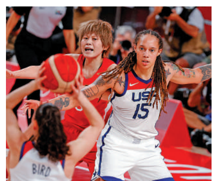
▲2020年東京奧運會上，格林納對陣日本選手。

格林納效力於美國女子國家籃球協會(WNBA)鳳凰城水星隊，曾在里約奧運會和東京奧運會上帶領美國隊奪得金牌。在WNBA休賽期間，格林納經常前往俄羅斯參加超級聯賽。格林納在俄球隊獲得的年薪超過100萬美元，是其在WNBA收入的四倍。根據俄海關總署的聲明，今年2月格林納從紐約乘坐飛機抵俄時，緝毒犬在其隨身行李中發現異常，海關搜查行李後發現裝有大麻油的煙彈。根據俄羅斯法律，持毒可判處5至10年徒刑。