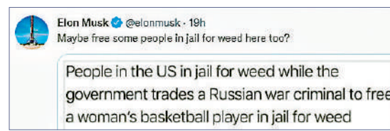
▲馬斯克對換囚冷嘲熱諷，稱美國應釋放因吸大麻入獄的犯人。

億萬富豪馬斯克則在推特發文稱：「也許應該釋放一些因為吸食大麻而坐牢的人？」馬斯克2018年曾在視頻採訪中公開發大麻，今年4月又稱要在可樂中加入可卡因。