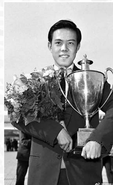
▲1959年4月22日，容國團載譽而歸。

入祖國的懷抱。1958年4月，容國團在廣東省體育工作者躍進誓師大會上放出豪言「3年內取得世界乒乓球錦標賽男子單打冠軍。」全場嘩然，因為當時，獲得世界冠軍對於中國人來說幾乎是無法想像的。