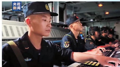
▲3日，中國人民解放軍東部戰區在台島周邊海空域組織實戰化聯合演訓。

7月1日慶祝中國共產黨成立100周年大會上，15架殲-20戰鬥機編隊亮相，引發熱議。