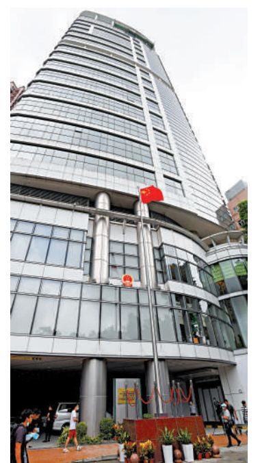
▲國安公署嚴正警告海外亂港分子，任何亂港行徑必將受到嚴懲。

駐港國安公署發言人強調，任何人、任何組織、任何勢力，無論身處何地、以何種方式、是任何身份，只要涉嫌組織、策劃、實施或者參與實施旨在分裂國家、破壞國家統一的活動，從事旨在顛覆國家政權的行為，都必將受到法律的嚴懲。