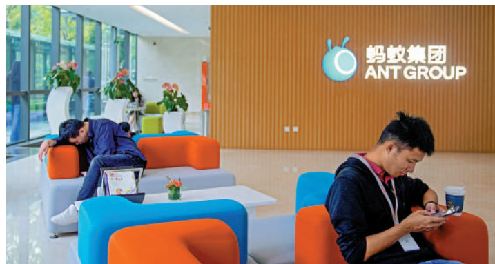
▲阿里巴巴持逾三成螞蟻集團股份。

期內，阿里巴巴的經營活動產生的現金流達338.69億元，按年微增長1%，自由現金流則升7%至221.73億元，當中反映收取來自螞蟻集團股息約39.45億元。