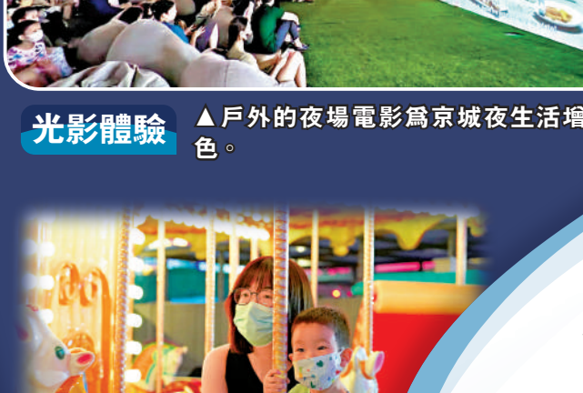
光影體驗 ▲戶外的夜場電影為京城夜生活增色。