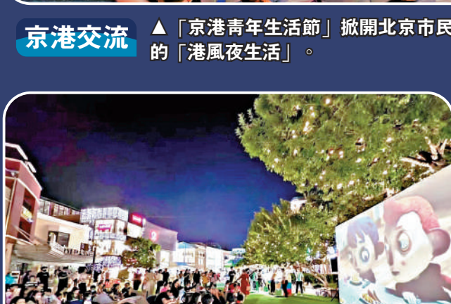
京港交流 ▲「京港青年生活節」掀開北京市民的「港風夜生活」。