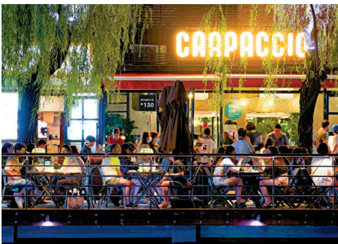
▲7月16日，市民在北京市朝陽區亮馬河國際風情水岸就餐。

在打造「夜京城」城市名片方面，方案提出，支持市場主體提升運營能力和品牌輻射力，打造10個左右具有影響力的「夜京城」特色消費地標，30個左右具有夜間消費顯著活力的「夜京城」融合消費打卡地，40個左右具有區域保障力的「夜京城」品質消費生活圈。