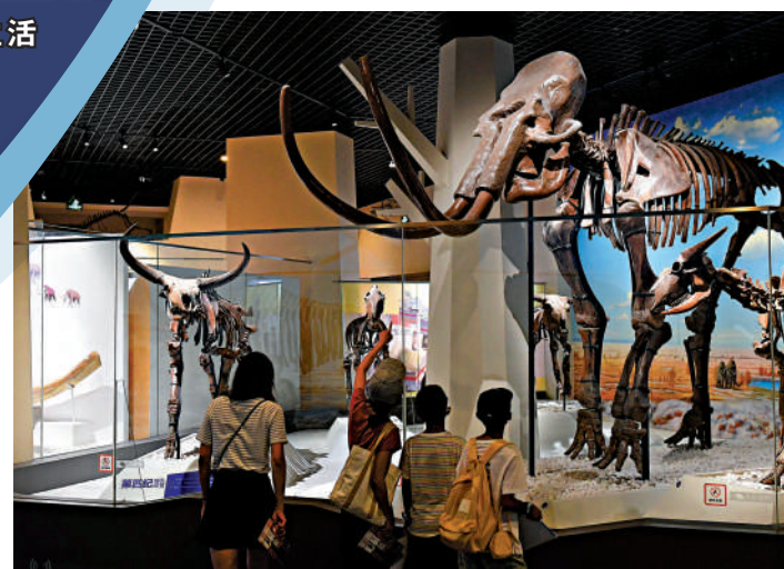
▶8月2日晚，家長帶着孩子在北京自然博物館觀看猛犸象化石。