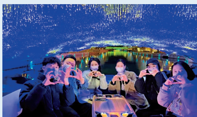
地 ▲一群青年在「夜京城」熱門打卡。

找到了夜間生活的一個絕美的場景。想着五光十色的河畔，悠遊自在的漫步，可以說，亮馬河已經成為北京夜經濟的新名片。