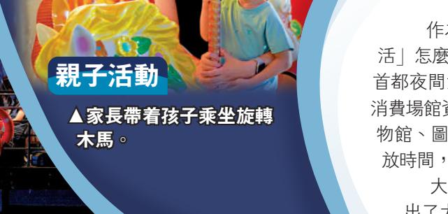
親子活動 ▲家長帶着孩子乘坐旋轉木馬。