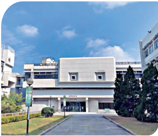
▲新亞書院錢穆圖書館。