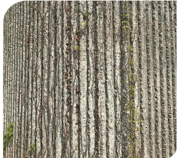
▲混凝土柱上綠色的藤蔓植物。