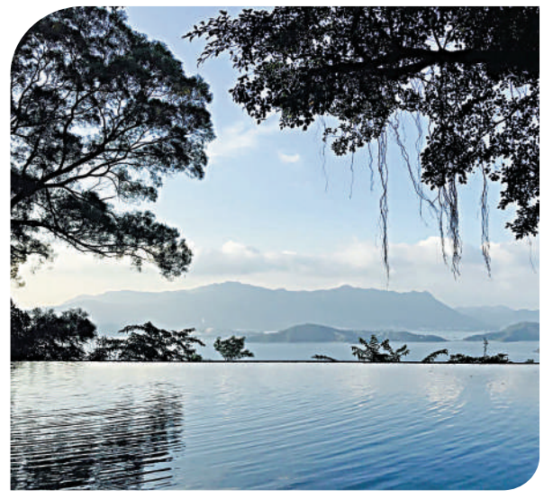
▲到訪合一亭，感受「天人合一」的境界。