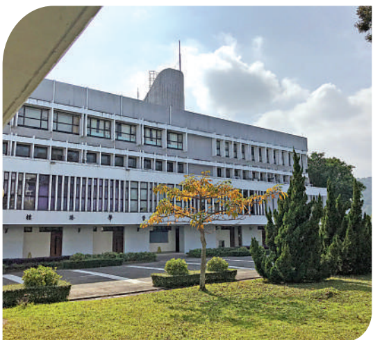
▲教學樓圍合的庭院裏綠意盎然。

每個書院都好像是一個小小的社區，有着自己特色的建築形象、空間圍合方式甚至氳氳着一股說不清道不明的獨特氣質。與新亞書院同為最早的三所創始書院之一的聯合書院，於二十世紀七十年代統一規劃設計，具有典型的現代主義建築風格，樸素、注重功能、舒展的橫向線條構成建築群的主要特色。同時受二十世紀六十年代風靡全球的粗野主義風格的影響，外露的不修邊幅的混凝土結構及其毛糙、沉重、粗野的質感使得聯合書院建築群更自然、豪邁地匍匐於山體之上。