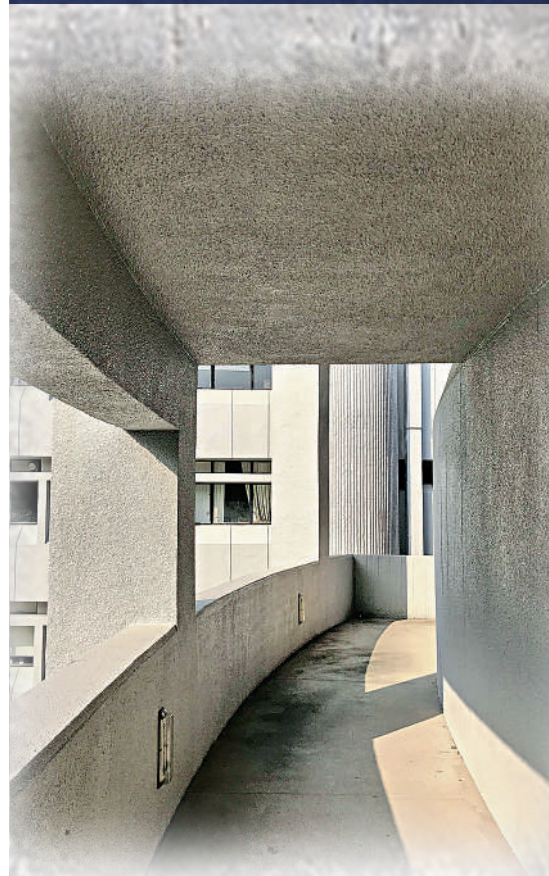
▲中大科學館的走廊。