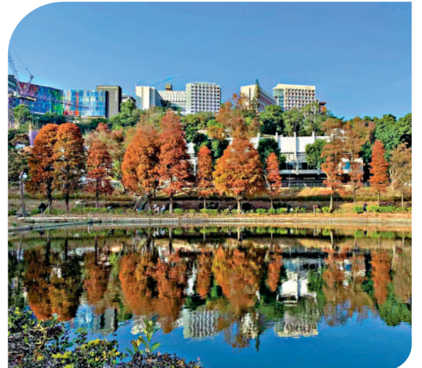
▲未圓湖畔落羽杉每年冬天會有不少紅葉。