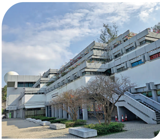
▲張祝珊師生康樂大樓。