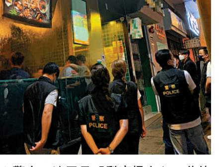
▲警方一連四日「犁庭掃穴」，共搗破四間懷疑非法賭檔及一間懷疑賣淫場所。

被捕者包括54名本地男子、17名本地女子、1名內地男子、3名內地女子及5名非華裔男子，年齡介乎19至75歲，分別涉嫌「刑事毀壞」、「傷人」、「盜竊」、「藏有危險藥物」、「管理賣淫場所」、「經營賭博場所」及「違反逗留條件」等罪行。其中兩人被扣留調查，其餘被捕人已獲准保釋候查，須於9月上旬向警方報到。