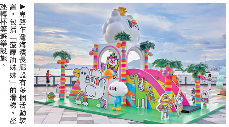
▲卑路乍灣海濱長廊設有多個活動裝置，包括「菠蘿油妹妹」的滑梯、冰淇淋轉杯等遊樂設施。

【大公報訊】發展局局長甯漢豪昨日發表網誌表示，現時維港兩岸海濱全長約73公里，其中38公里已劃作海濱長廊用途，現已開通供市民使用的約25公里，期望今年內再延長約1公里，並於2028年將維港的海濱長廊全面開通至34公里。東區走廊下之行人板道在2025年全面完成後，港島北岸的海濱長廊將可由堅尼地城駁道至筲箕灣。