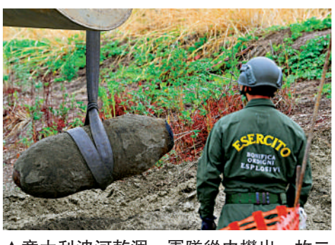
▲意大利波河乾涸，軍隊從中撈出一枚二戰時期的未爆彈。

的乾旱導致100多個城鎮沒有足夠飲用水。法國全國農民工會全國聯合會警告說，乾旱導致糧食短缺，代表未來幾個月牛奶也會跟着短缺。 全國2/3人口居住在海平面以下的荷蘭，過去以抗洪治水工程聞名於世，如今卻面臨史上少見的旱災。荷蘭政府3日宣布一系列抗旱政策，力求保障溝渠系統、飲用水和能源。 荷蘭政府成立的缺水應對小組MTW表示，全國水位達到歷史最低點，從荷蘭境內出海的萊茵河水量比往常少了50%。萊茵河下游的航運能力已減半，這段水路是從荷蘭鹿特丹港運煤炭到德國的命脈。