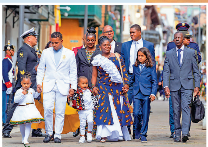
▲馬爾克斯（中）成為哥倫比亞首位黑人女副總統。