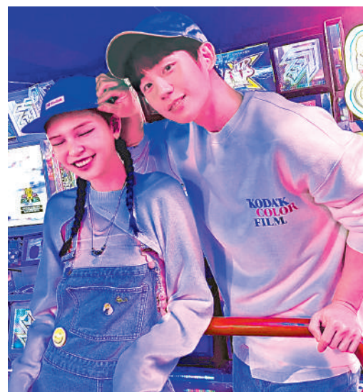
▲Rozy與韓國人氣男星丁海寅的合照。

打造出Rozy的Sidus Studio X則否認，認為Rozy並不屬於大眾審美中的美女，她臉上的雀斑和間距較寬的眼睛亦偏離韓國傳統審美。