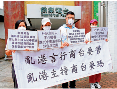
▲有團體昨日到商業電台，要求杜絕主持人利用平台播毒。

個別商台主持利用平台發放反中亂港言論，誤導市民，將節目變成了其個人政治宣傳的平台，因此強烈要求通訊局對傳媒嚴加督管；同時要求商台及時制止主持及嘉賓的言行，並追究責任。