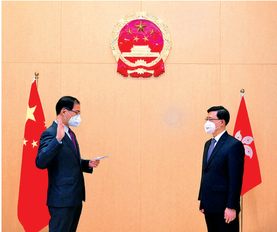
▲區志光（左）昨日在特首李家超（右）監誓下宣誓就任香港特區國安委秘書長。

《香港國安法》規定，香港特區設立由行政長官擔任主席的香港特區國安委，負責維護國家安全事務，承擔維護國家安全主要責任，並受中央人民政府監督和問責。香港特區國安委下設秘書處，由秘書長領導。香港特區於2020年