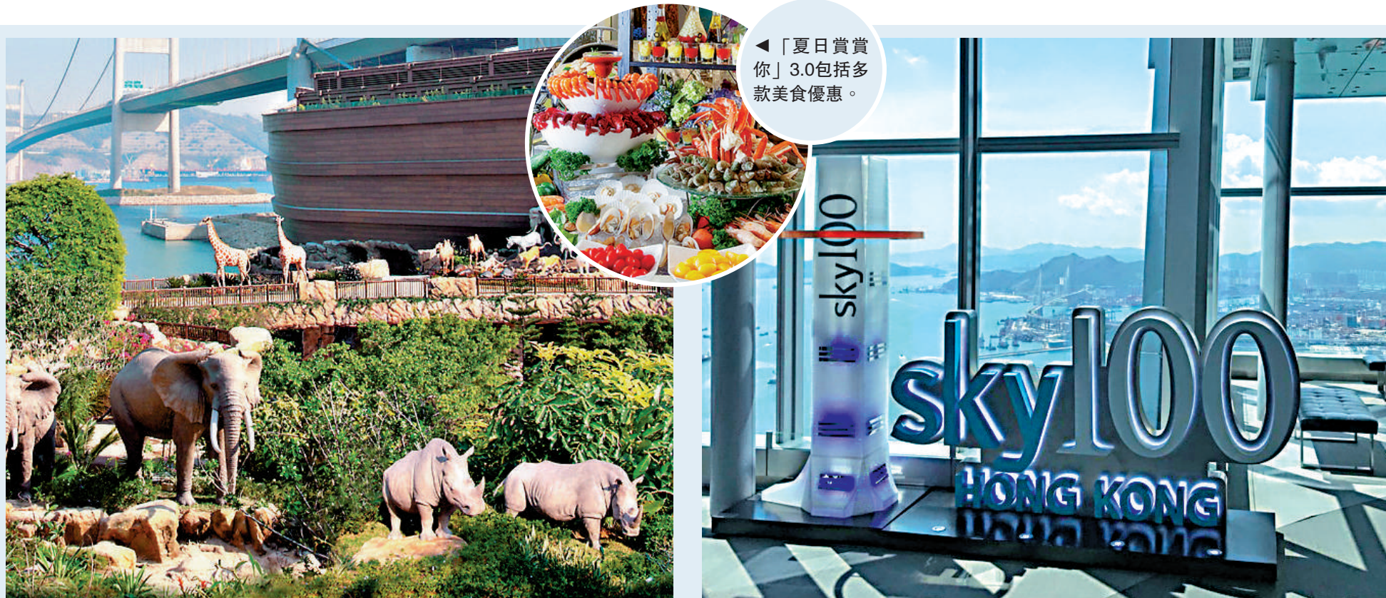
▲挪亞方舟入場門票連豐盛晚餐套票（左圖）及天際100香港觀景台「我愛香港二人下午茶套票」（右圖），均以二五折推出優惠。

旅遊發展局限量獎賞活動「夏日賞賞你」，將於明日中午12時起，派發第三輪62款、共4.8萬份優惠。今次優惠繼續低至二五折，包括舖記酒家滿1000減50、金至尊珠寶滿3000元減2000、牛瀾鍋72元1人放題等。名額有限，先到先得！若市民錯過本批獎賞，最後一批搶領為8月25日。