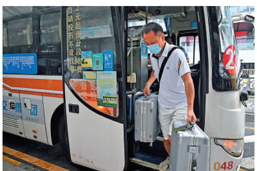
▲8月9日，滯留三亞的遊客走下大巴，準備進入機場。

據悉，8月1日至9日12時，海南省本輪疫情累計報告陽性感染者1899例，其中確診病例1314例，無症狀感染者585例。其中三亞市確診1045例，無症狀感染者513例。