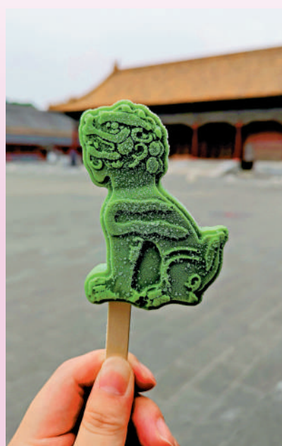
▲故宮雪糕成為遊客打卡工具。