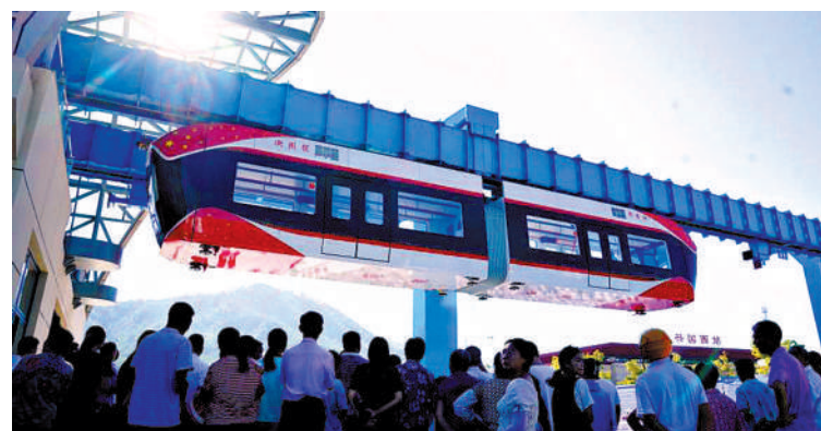
▲8月9日，「紅軌」列車停靠在江西興國縣永豐站。

針對如何保持文創雪糕長紅不衰的問題，有業內人士表示，這需要在品質創作上下功夫，挖掘產品內在的文化價值，增加產品的文化特性，形成景區特色，提升對遊客的吸引力。