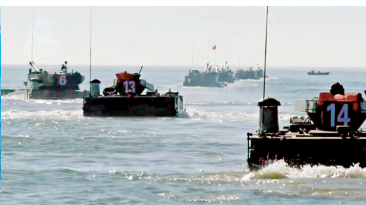
▲兩棲合成旅各突擊隊向目標海域編波機動。