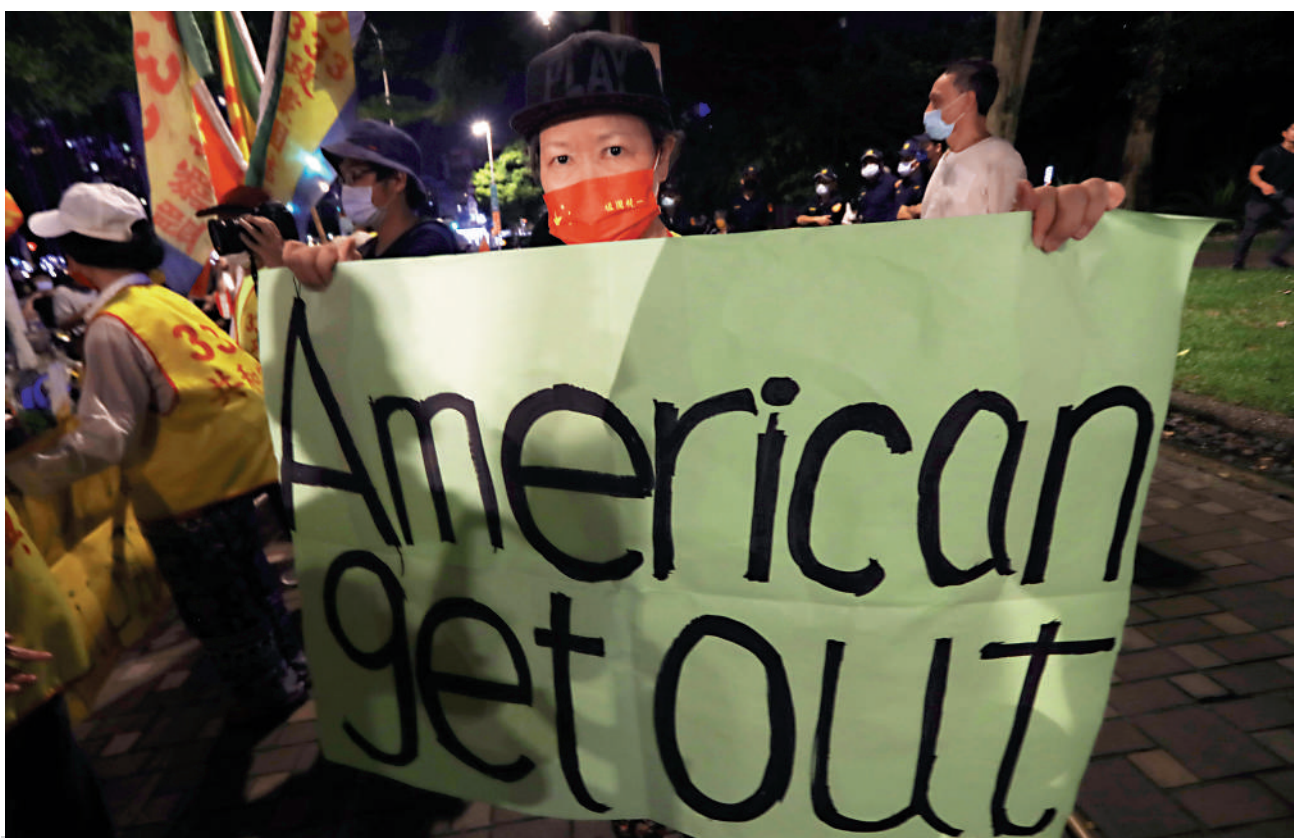
▲台灣民眾上週舉行集會，抗議美國國會眾議長佩洛西竄台導致台海局勢升溫。資料圖片

民怨載道 【大公報訊】據台媒報導：台灣最新民調數據顯示，針對美國國會眾議長佩洛西竄訪台灣地區，島內45.1%的台灣民眾認為弊大於利，27.4%認為利大於弊，22.9%認為利弊各半。對民進黨當局的兩岸政策，不滿意者則高達59.3%。 民調還顯示，若台海發生戰事，有56.2%的台灣民眾認為美國不會「出兵助台」，53.9%的人認為日本不會「出兵助台」。島內學者指出，台灣基層民眾，尤其是南部農漁業者，對大陸經濟反制舉措的感受較為強烈，皆因民進黨當局附和佩洛西「訪台」招來橫禍。