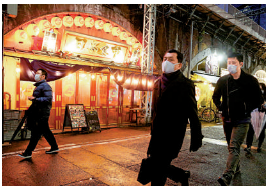
▲民眾經過東京一條餐館酒吧街。

【大公報訊】據日經新聞網報道:日本厚生勞動省5日公布的每月統計數據表明,剔除物價變動影響的6月實際工資同比減少0.4%,連續3個月負增長。雖然公司給員工加薪,但跑不贏日圓貶值及俄烏戰爭帶來的食品及能源的價格上漲。