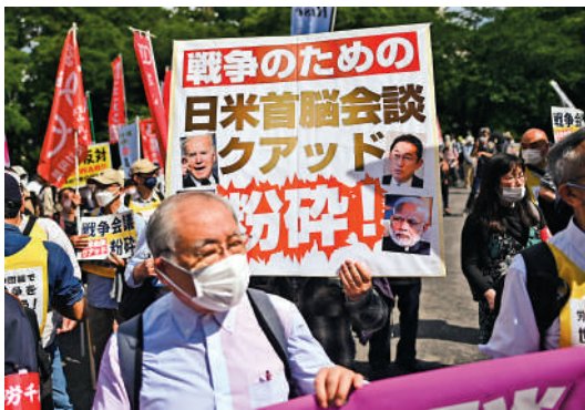
▲美國總統拜登5月下旬訪日時,大批日本民眾在東京舉行反美示威。

【大公報訊】據日本每日新聞報道:日本近來在俄烏衝突、台灣問題、芯片生產等問題上,不顧本國民眾切身利益,隨美國起舞,在國際社會造成惡劣反響。日本自民黨前副總裁山崎拓接受日媒訪問時表示,日本若盲從美國,與中國為敵,是十分危險的。