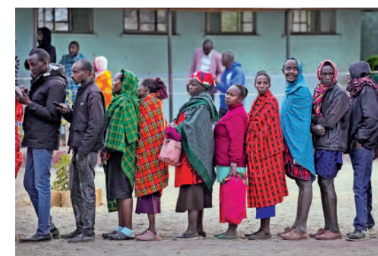
▲民眾9日在內羅畢一個票站排隊投票。

選委會表示,約有60%的登記選民投了票。一些未去投票的民眾稱,對政府感到失望,北部的乾旱迫使400多萬肯尼亞人依賴救濟糧餉,食品和燃料價格飛漲,他們無力負擔。