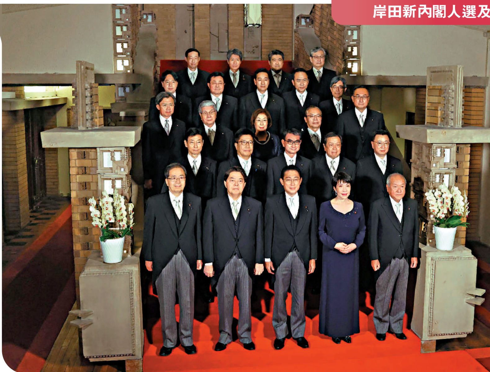
▲日本首相岸田文雄(前排中)10日率領新內閣拍攝大合照。