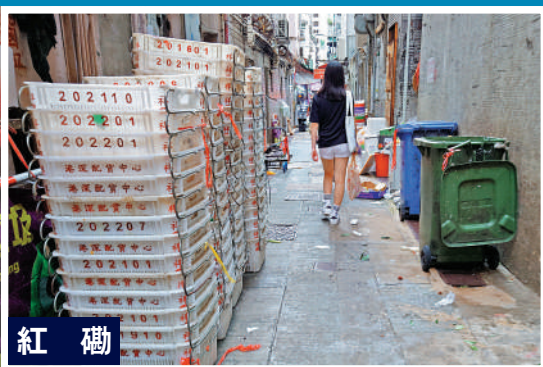
▲後巷放滿膠箱，阻塞通道。