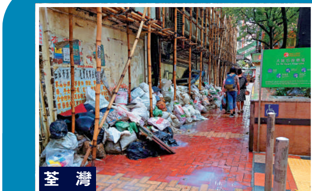
▲遊樂場外的後巷擺滿一袋袋建築廢材，無人清理。