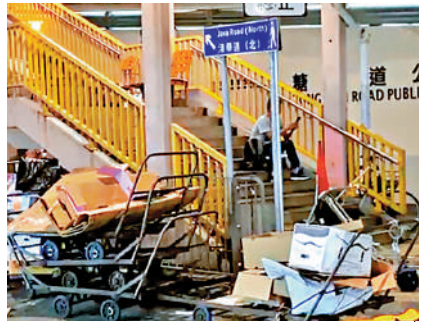
▲春秧街與糖水道交界的天橋底，堆滿垃圾及床、手推車等雜物。