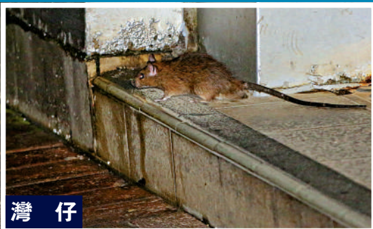
▲交加街的街市兩旁有不少大牌檔，晚上成了老鼠的高級餐廳。