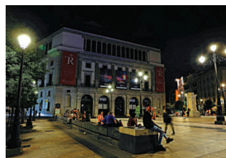
▲因應西班牙實行新的節電政策，王室劇院晚上需要熄燈。

新節電措施限制商業場所、娛樂場所、行政大樓、車站和機場的溫度，夏季冷氣室內溫度不得低於27°C，冬季暖氣不得高於19°C。酒吧、餐館和部分商店則不得低於25°C，而商店櫥窗須在夜晚10點熄燈。考量到行業特殊性，工廠、醫療機構、健身房、洗衣店、理髮店、旅館客房等地可豁免。同時，具有