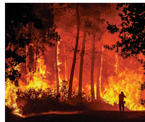
▲法國西南部吉倫特地區的山火連續肆虐多天。

法國生態轉型部部長貝舒表示，法國超過100個市鎮的供水管道已沒有飲用水，「這些市鎮不得不使用貨車運輸用水」。高溫也加劇了法國能源供應的緊張，法國西南部加龍河水溫升高導致河水冷卻的能力下降，沿岸的核電廠不得不宣布減產。