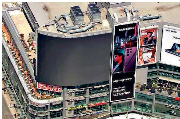
▲加拿大多倫多市中心中央一登打士廣場的大型廣告屏幕因停電而變暗。

【大公報訊】綜合報道：加拿大多倫多市中心11日大面積停電，導致多人被困電梯，包括一名內閣部長。據悉，停電原因是一台起重機破壞了部分高壓電線。各國電網也在能源危機和極端天氣的情況下變得異常緊張，民眾亦不得不開始應對缺電或停電下的緊急狀況。