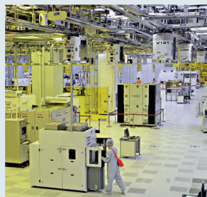
▲SK集團計劃增加在美投資，圖為SK海力士在韓國的工廠。資料圖片