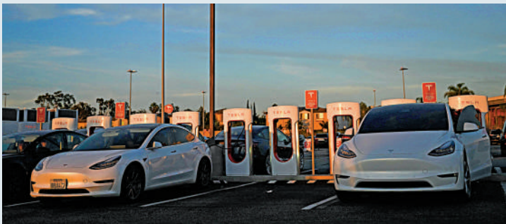
▲只有少數車企滿足美國電動車減稅政策的要求。

共同社12日指出，法案針對的是在電動車市場上佔壓倒性優勢的中國，但就算是美國車企也很難滿足相關要求，日企更感到焦慮。目前滿足條件的除美國通用汽車和Tesla等之外，日本車企僅有日產汽車一家。