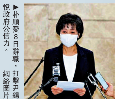
朴順愛8日辭職，打擊尹錫悅政府公信力。

7月4日，尹錫悅跳過人事聽證會，直接任命有醉駕和論文抄襲黑歷史的朴順愛出任副總理兼教育部長官。然而，朴順愛提出將小學入學年齡下調至5歲，引起家長和教師強烈不滿。8月8日，她上任僅34天就宣布引咎辭職。