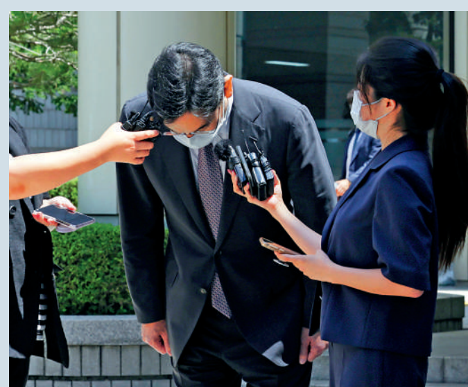
▲李在鎔將於15日被特赦，引發巨大爭議。

尹錫悅12日在龍山總統府主持召開臨時國務會議並敲定光復節特赦名單，包括李在鎔、辛東彬、東國製鋼會長張世宙、STX集團前會長姜德壽等。韓國政府方面表示，國家經濟危機問題亟待解決，因此將「有能力推進國家經濟發展的主要經濟界人士」列入赦免名單。