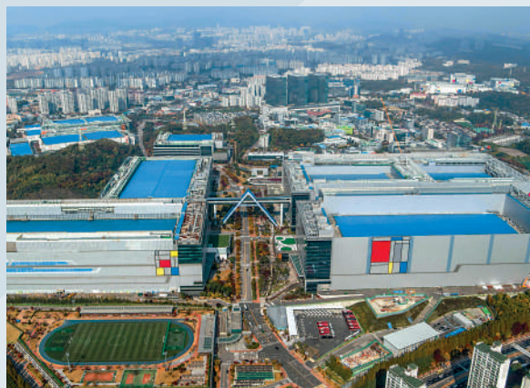
▲三星與韓國經濟密切相關，圖為三星的半導體工廠。

前總統李明博2020年因貪污受賄被判囚17年，今年6月因病獲准暫停監禁3個月，尹錫悅此前曾公開表示有意赦免他，但最終未將其寫入名單。一名總統室官員透露，尹錫悅改變主意的主要原因是自身支持率近期跌破30%，「不得不更加在意輿論風向」。一名顧問指出，與李在鎔不同，對赦免李明博的負面輿論更多。前總統朴槿惠已於去年底獲得文在寅政府特赦，今年1月正式出獄。