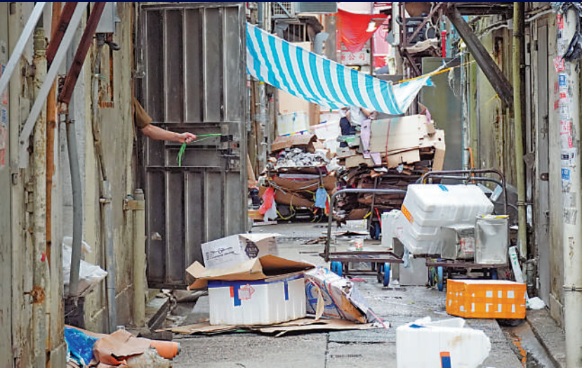
▲針對政府提出的打擊衛生黑點計劃，多位立法會議員表示歡迎，但希望政府能堅持打持久戰，改善各地區環境衛生問題。