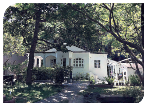
▲龍虎山環境教育中心主體建築：展覽廳。

據說此處曾經是一位園境建築師的居所，因此花園裏種滿各式或本地或外來樹種，搭配巧妙、相得益彰。花園裏還有一座小水池，池岸由片石隨意堆疊而成，石縫中各種綠葉「探」出腦袋，雖為人造，卻似天成。據工作人員介紹，夜間此地還會變身「野生動物狂歡派對」，附近的野豬和其他野生動物都會從中心一側柵欄特意留出的小門「粉墨登場」，在花園裏覓食、玩耍，還能在水池裏飲水、沖涼。第二天地上的樹枝殘跡便是牠們的「到場證明」。與中心的後院以一條水泥小徑相隔的就是龍虎山了，行山的人們也可以從一個小門進入中心，參觀之後若從前門離開，行不多遠就會到達港大校園。行龍虎山，在享受自然的同時，也感知到人文歷史的無限魅力。