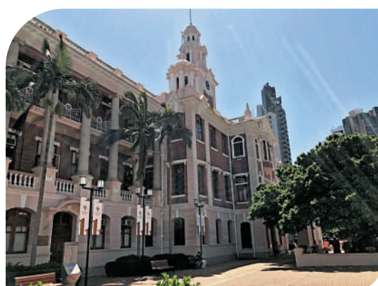
▲愛德華時期巴洛克風格的本部大樓。

當觀者仍沉醉在本部大樓的含蓄優雅時，倏地一個混凝土「龐然大物」出現在眼前，倒金字塔形的支柱由一個巨型墩生出四個枝杈，直通