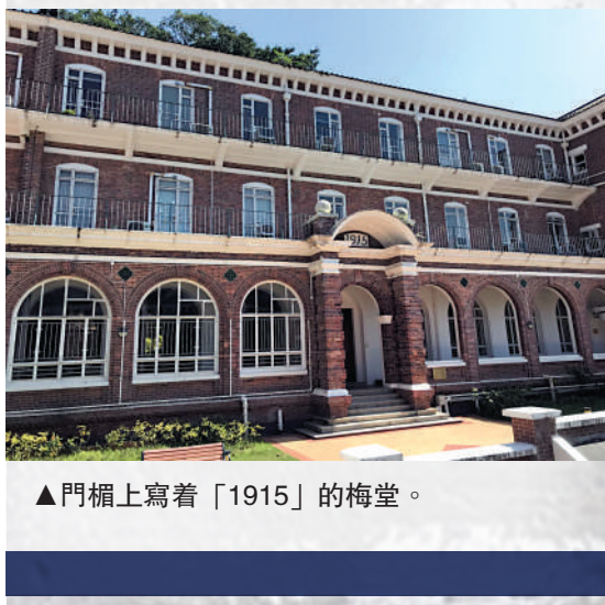
▲門楣上寫着「1915」的梅堂。