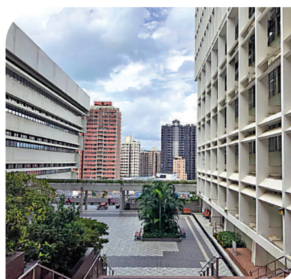
▲鈕魯詩樓、圖書館大樓，以及二者圍着的中山廣場。