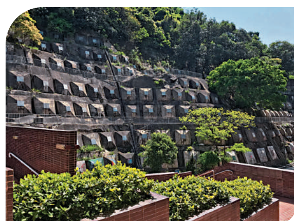
▲黃克競樓對出的「土釘牆」。