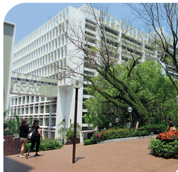
▲紅磚鋪地的中山階。