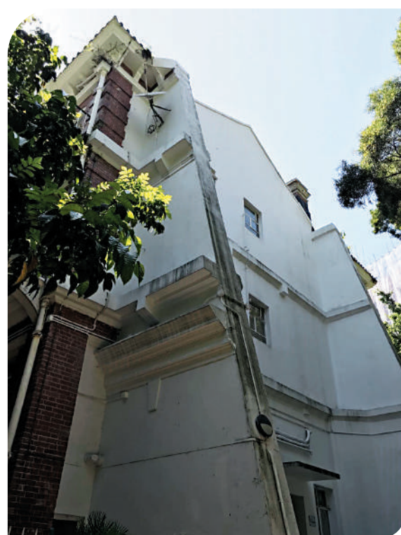
▲儀禮堂因歷史上山洪傾瀉，部分清拆、維修而留下的山牆斜撐。