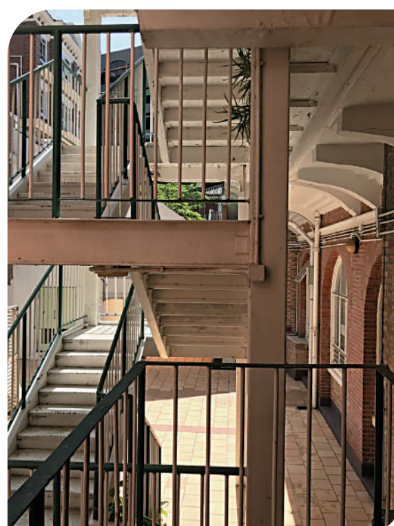
▲儀禮堂背面的小樓梯。

在港大校園這一個多世紀的「時光隧道」裏，處處可見歲月的痕跡，或大或小、或深或淺、或顯著、或蒙塵，隨手探摸，均是珍寶。