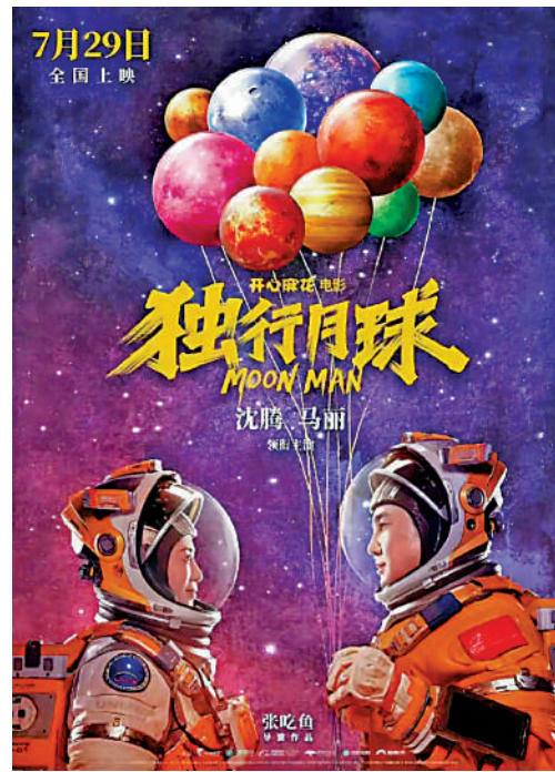
▲從獨孤月面對各種險阻也要從月球返回地球，我們可以看到儘管兩岸統一之路有點崎嶇，但台灣這個遊子終將回家。

開心麻花出品的電影《獨行月球》於中國傳統節日七夕節上映，這部科幻喜劇大片講述被意外遺落在月球基地的「最後的人類」獨孤月跨越38萬公里，衝破各種險阻、心心念念要返回地球的「回家之路」。宇宙級的鄉愁感動了觀眾，跨越星河拯救愛人與地球的英雄之舉讓人笑淚交織。我們仰望皎潔的月亮時，想到的不只是玉兔陪着嫦娥垂淚，喜鵲載着牛郎織女歡聚，還有胸肌發達的金剛袋鼠拉着鬍子拉碴的發福大叔踏着滑板飛越月亮的搞笑畫面，激情飛揚還無比浪漫。